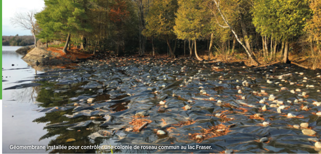
Géomembrane installée pour contrôler une colonie de roseau commun au lac Fraser.

S.V.P., afin de nous aider à protéger les forêts du parc, nous vous demandons de ne pas transporter de bois de chauffage dans vos bagages.