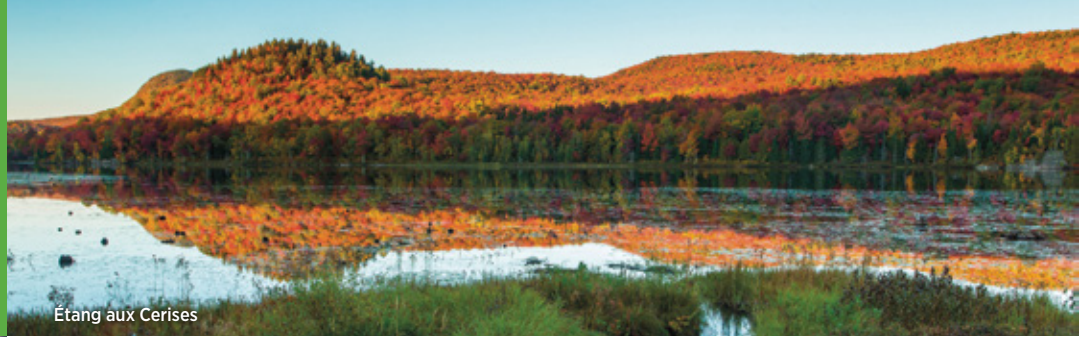
Étang aux Cerises