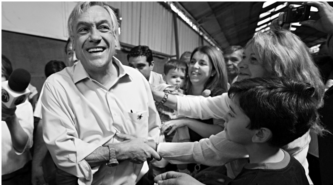
Sebastian Pinera était arrivé en tête du premier tour, le 13 décembre.

Le jeune et fringant Marco Enriquez-Ominami, indépendant et fils d'un des fondateurs du MIR (Mouvement de la gauche révolutionnaire) assassiné par la dictature en 1974 et élevé en exil en France, avait créé la surprise en décrochant 20 % des voix. Jorge Arrate, candidat de Junto Podesmos, l'alliance autour des communistes, avait déjà fait affaire