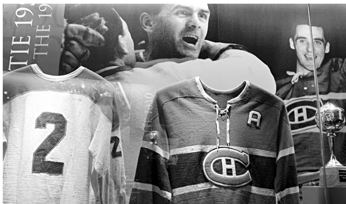
Plusieurs chandails d'époque et quantité d'autres pièces de collection sont exposés au nouveau Temple de la renommée du Canadien, au Centre Bell.

L'inauguration du musée, qui sera accessible au public dès aujourd'hui moyennant prix