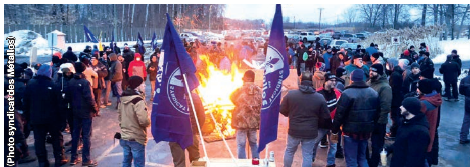
Les Métallos d'ArcelorMittal à Contrecœur sont en grève depuis le 2 février.

« Nous sommes bien conscients de la période d'inflation actuelle, alors que les pénuries de main-d'œuvre sont grandes, s'est exprimé le représentant syndical Michel Courcy.