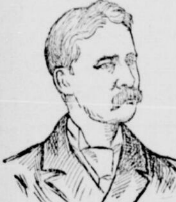
M. HOWLAND, ex-maire de Toronto, président de l'Union.

Ottawa, 17, (Spéciale). — La troisième convention annuelle de l'Union des municipalités canadiennes est commencée hier à l'hôtel de ville d'Ottawa.