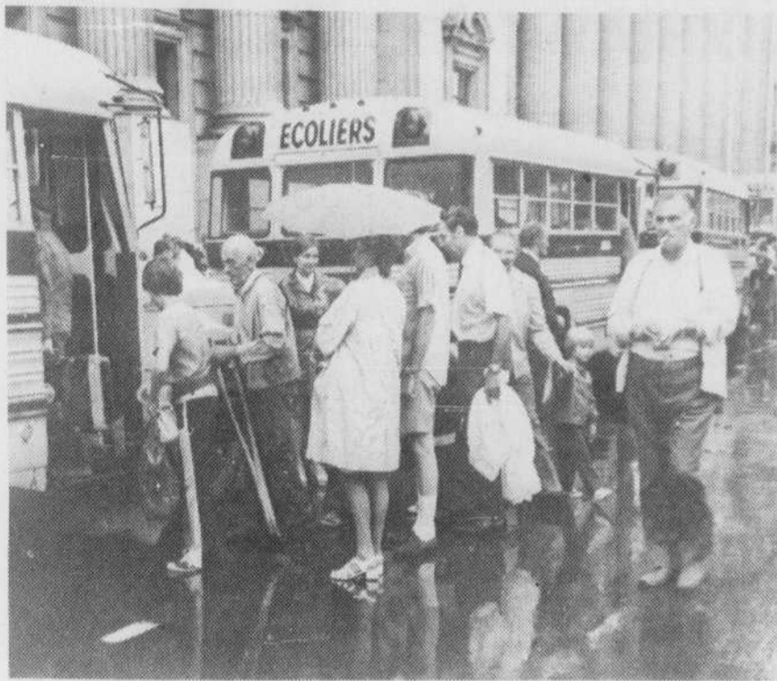
Environ 150 écoliers quittaient hier matin le Square Dominion à Montréal en direction de cinq autres régions du Québec. Agés de 12 et 13 ans, ils ont été choisis parmi 800 candidats pour participer à un programme d'échange interprovincial subventionné par l'entreprise privée et le gouvernement. Au cours des prochaines semaines, des foyers montréalais hébergeront des écoliers de la Gaspésie, du Saguenay et d'ailleurs.