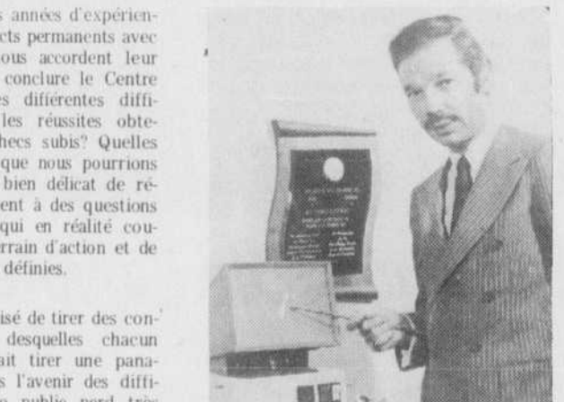
P.S. Nous avisons notre clientèle de la province, que l'étude capillaire initiale se fait exclusivement à notre bureau de Montréal. Le Centre Capillaire Pierre n'a pas de délégués parcourant la province en son nom. Toute représentation utilisant le nom du Centre Capillaire Pierre s'avère frauduleuse. par Raymond Tienne R.A.P. LD26A TRICHOLOGUE

Après de nombreuses années d'expérience capillaire de contacts permanents avec les personnes qui nous accordent leur confiance, que peut conclure le Centre Capillaire Pierre des différentes difficultés rencontrées, les réussites obtenues, parfois les échecs subis? Quelles sont les espérances que nous pourrions lui accorder? Il est bien délicat de répondre catégoriquement à des questions aussi simples mais qui en réalité couvrent un immense terrain d'action et de soins; sans règles bien définies. Il nous est très malaisé de tirer des conclusions concrètes desquelles chacun des individus pourrait tirer une panacée pour éviter dans l'avenir des difficultés capillaires. Le public perd très souvent de vue que la chevelure n'est pas uniquement un élément décoratif, mais au contraire une partie intégrée du corps humain qui est régie par les nombreuses lois de complexité connue ou inconnue. Jugez par vous-même avant de suivre des conseils qui peuvent s'avérer fantaisiques et erronés. Prenez donc rendez-vous. Nos trichologues sauront vous conseiller.