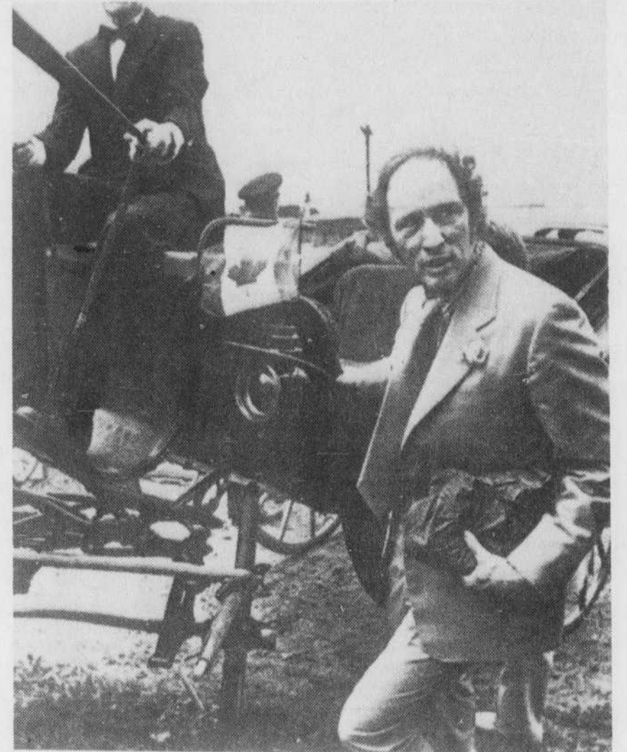
Le premier ministre Trudeau a dû faire à pied, samedi, le parcours qu'on avait voulu lui faire faire en carrosse, sur les terrains du pageant militaire de Prescott, en Ontario, la monture d'un des deux chevaux s'étant brisée.