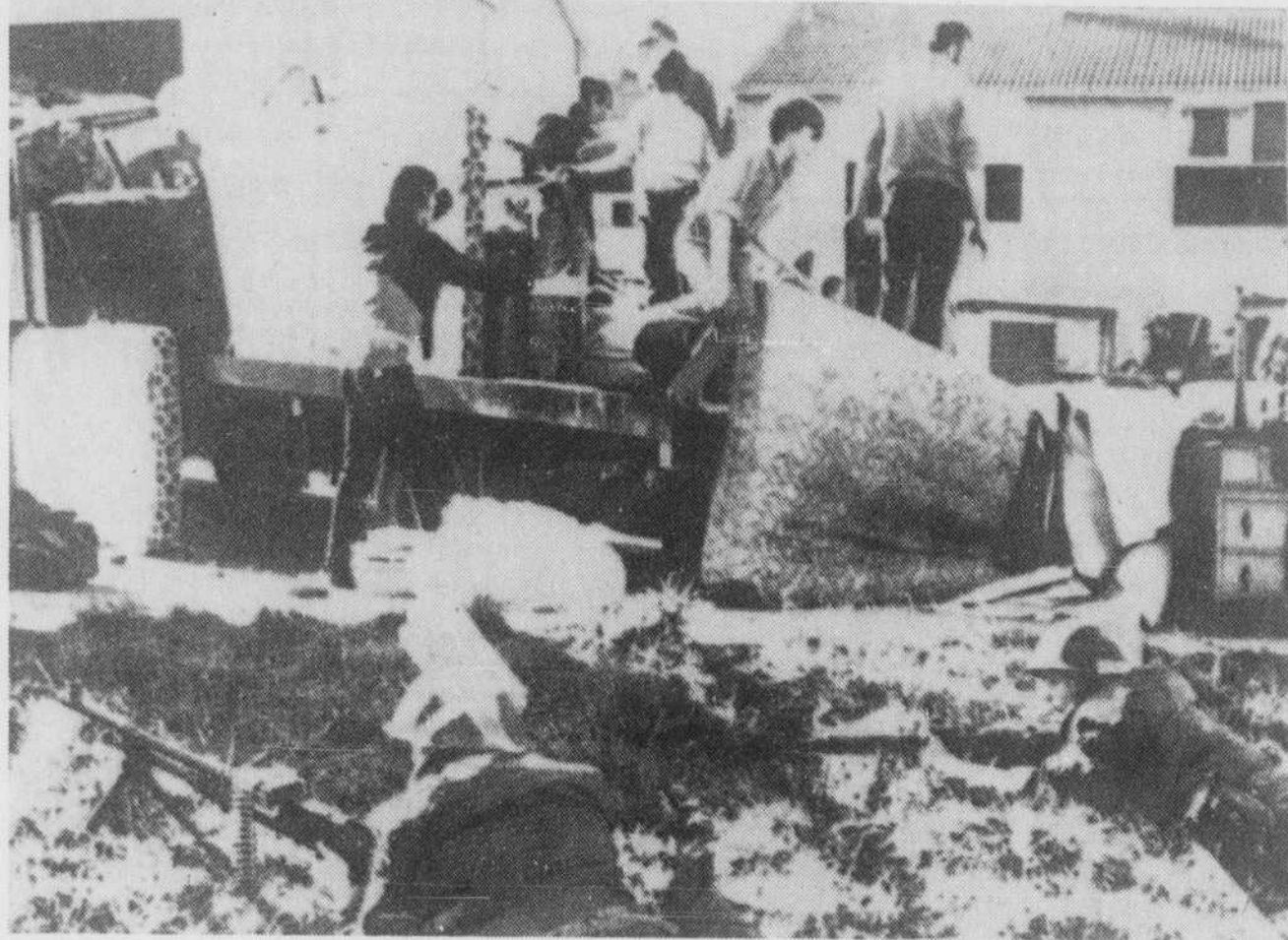
N'emportant que le strict minimum, femmes et enfants quittent le quartier de Linadoon, pour protester contre la présence des soldats que l'on remarque au premier plan. On estime que 5.000 personnes ont ainsi abandonné leur foyer.

BELFAST (AFP) — Cinq mille habitants du quartier de Lenadoon, à Belfast, principal théâtre des violentes batailles de ces derniers jours, ont abandonné hier leurs maisons et pris le chemin de l'exode pour protester contre la présence des sept cents soldats britanniques retranchés à Lenadoon.