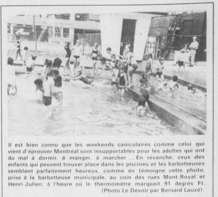
Il est bien connu que les weekends caniculaires comme celui qui vient d'éprouver Montréal sont insupportables pour les adultes qui ont du mal à dormir, à manger, à marcher... En revanche, ceux des enfants qui peuvent trouver place dans les piscines et les barbotteuses semblent parfaitement heureux, comme en témoigne cette photo, prise à la barbotteuse municipale, au coin des rues Mont-Royal et Henri-Julien, à l'heure où le thermomètre marquait 91 degrés F.

Parmi les concessionnaires que nous avons pu rencontrer, tous se disaient très déçus de la courte durée de l'exposition. C'est notamment vrai pour ceux qui prévoient avoir plusieurs boutiques et qui se retrouvent finalement avec une seule à cause de la fermeture de l'île Notre-Dame. Un concessionnaire a même envisagé de hausser ses prix pour faire plus d'argent.