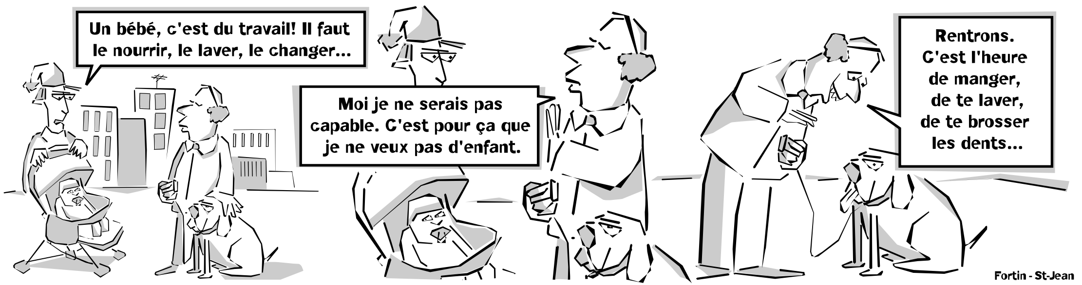
Fortin - St-Jean