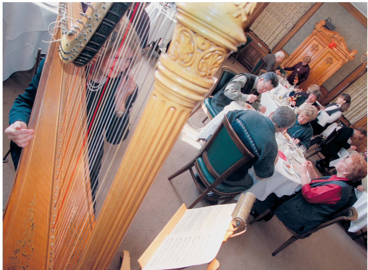
Le Mount Stephen, classé monument historique, a ouvert ses portes au public tous les dimanches pour un brunch familial.

On recrute, on fait peau neuve, on fait de la pub!