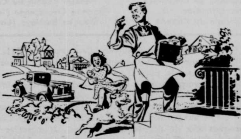
AVANT LA GUERRE: le jeune Jimmy Burke faisait la livraison des épiceries et il rêvait peut-être de posséder un jour son propre magasin.