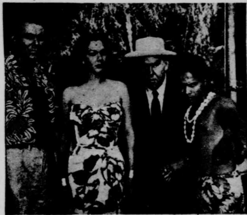
Jon Hall, Maria Montez, Sidney Toler et Sabu dans une scène du merveilleux film en couleurs "White Savage", à l'affiche au Théâtre Impérial, Dim.-Lun.-Mar.-Mer., les 25-26-27-28 Juillet.

"Engraissés au lait" Spécial — 6 lbs. et plus 37¼c A—6 lbs. et plus 36¼c A—5 lbs. jusqu'à 6 lbs. 35¼c B—6 lbs. et plus 33¼c B—5 lbs. jusqu'à 6 lbs. 32¼c B—4 lbs. jusqu'à 5 lbs. 31¼c (Suite à la page 18)