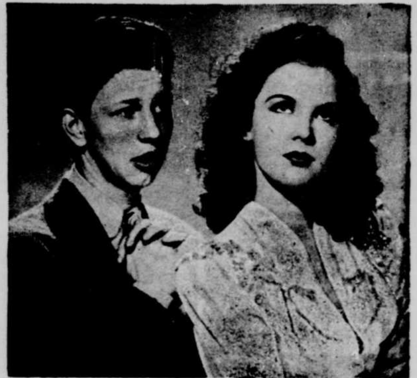
Donald O'Connor et Gloria Jean, vedettes du film "It Comes Up Love", à l'affiche au Théâtre Impérial, Dim-Lun-Mar-Mer, les 25-26-27-28 juillet.