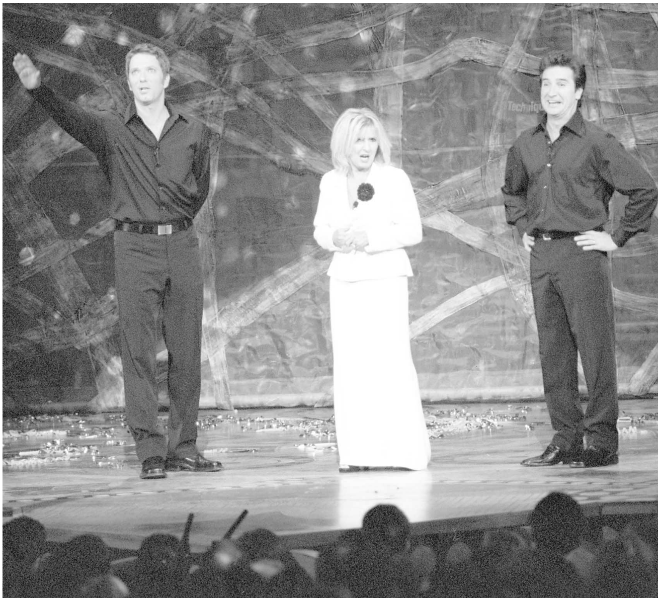
Que d'excellents numéros – ou presque – au gala du Festival Juste pour rire d'hier. Ci-dessus, la coanimatrice Dominique Michel en compagnie de deux vieux complices des Bye Bye , Patrice L'Écuyer et René Simard.

L'invité suivant n'est pas un humoriste mais rêvait depuis longtemps de passer au gala du Festival Juste pour rire. Et effectivement, il a passé au gala en nous disant