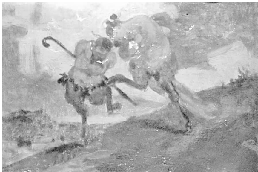
Le fameux tableau, une huile de 20 x 25 cm non signée et non datée, attribué au peintre Francisco Goya.

AH, LE RIRE ! Il y a des centaines de façons de le déclencher — le Festival Juste pour rire s'efforce d'en faire la preuve ces jours-ci. Mais il y en a au moins autant de rater sa cible. Or y a-t-il quelque chose de plus pathétique que le comique pas drôle ? Non. La preuve, ici, se trouve dans L'Extra Terrestre . Une comédie (paraît-il) de et avec Didier Bourdon (ça, c'est sûr) qui, à force de (mal) faire, parvient à arracher deux ou trois sourires à l'adulte moyen — et un peu plus (rendons à César...) à l'adulte en devenir. Imaginons Les Visiteurs de Poiré venus du futur. Le choc dépasserait celui de l'atterrissage forcé. Ainsi Zerph, poursuivi par deux « terminators » descendant sûrement de Dumb and Dumber , découvre-t-il notre Terre technologiquement archaïque mais humainement intéressante — ne serait-ce que pour ce qui se passe dans les chambres à coucher. Bref, soucoupe volante ou pas, ça vole pas haut.