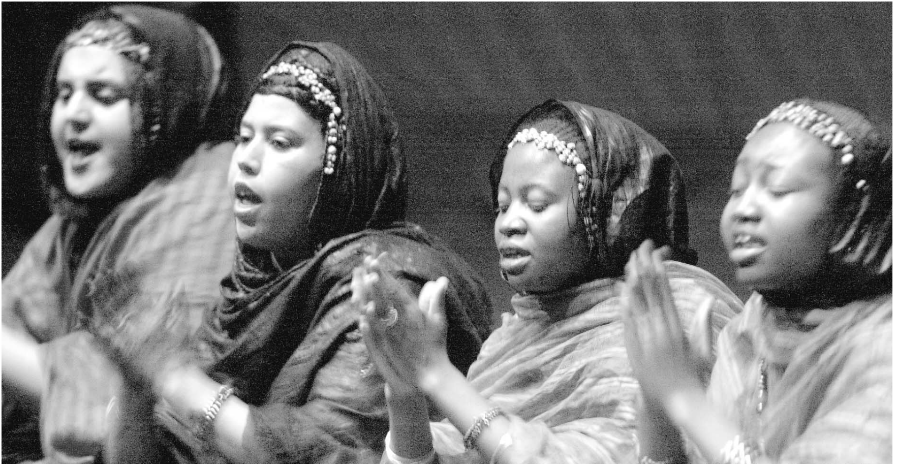
Quatre des membres de la troupe de danse Ali-Gadra, de Goulmina, au Maroc.