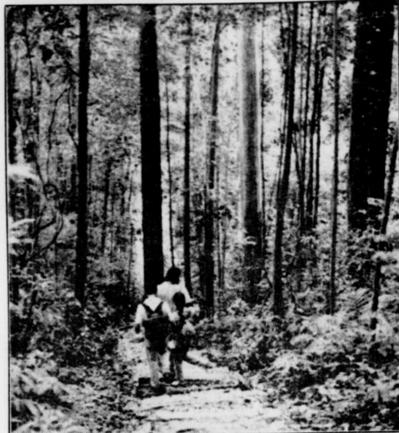
La réserve naturelle de Bukit Timah abrite des centaines d'espèces d'arbres rares et d'oiseaux.

Pour organiser des tours d'interprétation de la faune et de la flore à la Réserve naturelle de Bukit Timah, au Parc Pasir Ris et en d'autres sites naturels de Singapour, communiquer avec l'Office du tourisme de Singapour (Singapore Tourist Promotion Board), 175 Bloor St. est, bureau 1112, Toronto, Ont., M4W 3R8; tél.: (416) 323-9139.