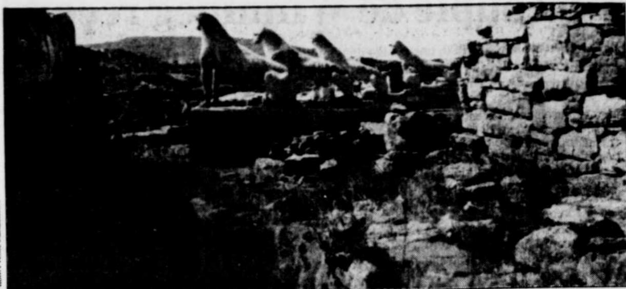
Les vestiges d'un des nombreux temples que l'on peut visiter sur les îles qui émaillent la mer Égée.

La populaire île de Paros, au sud-est de Syros, accueille aujourd'hui plus de véliplanistes et de baigneurs que de mineurs, mais ce ne fut pas toujours ainsi. L'île, qui est réputée pour son marbre extrêmement translucide, a fourni à des sculpteurs célèbres la ma-