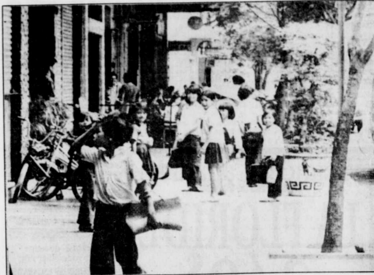
L'une des choses qui frappent agréablement le touriste, c'est l'amabilité et la bienveillance des gens.

Pour d'autres renseignements, communiquer avec l'Ambassade du Viêt-nam, 85 Chemin Range, Bureau 802, Ottawa, Ont., K1N 8J6; tél.: (613) 565-2292.