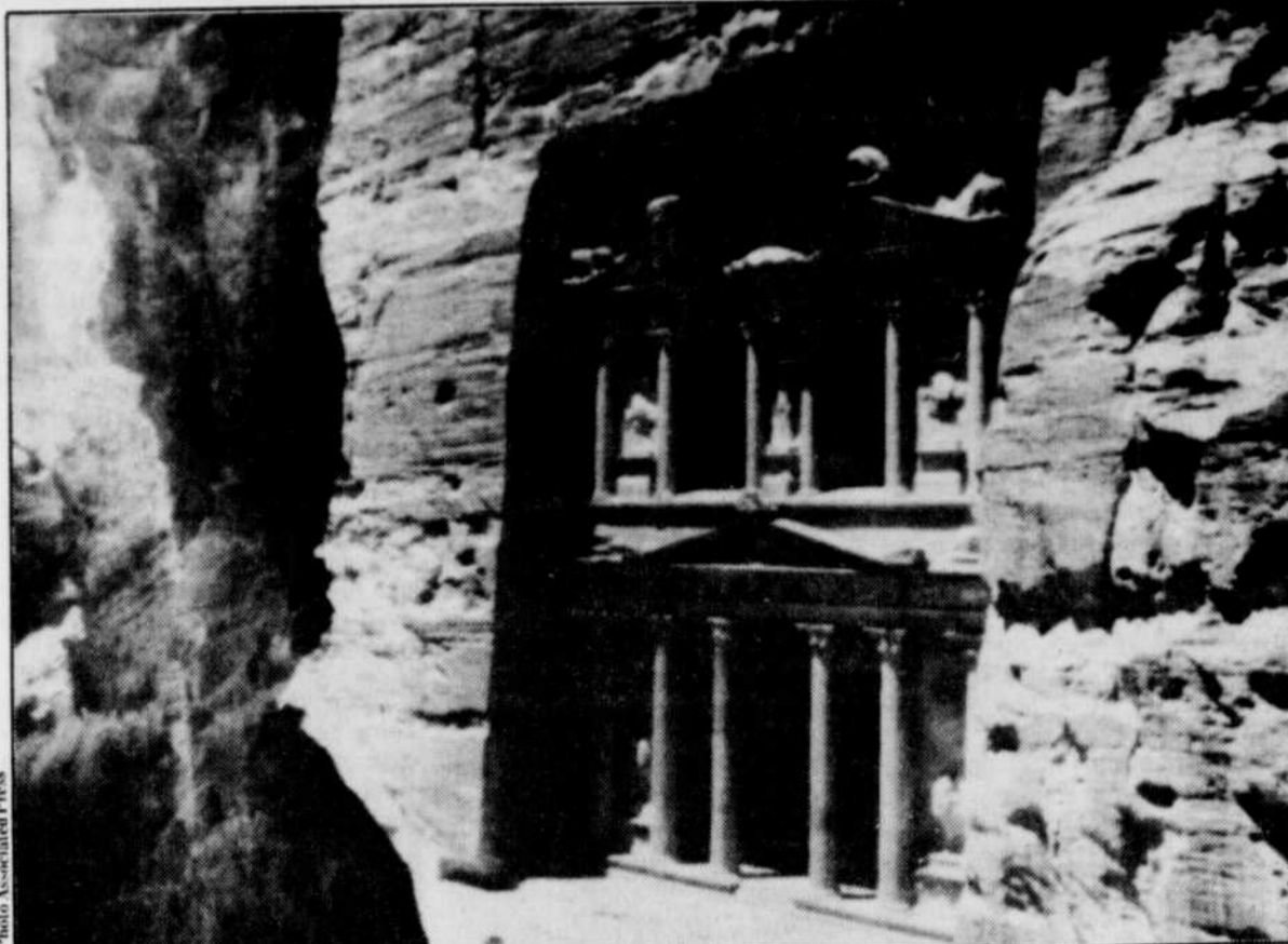
La sculpture intitulée « The treasury » est certainement la plus spectaculaire de toutes celles que l'on peut observer dans les célèbres rochers rouges de la ville de Pétra, au sud de la Jordanie.

de Wadi Musa, une ville située à proximité du Siq — étroit col montagneux menant à Pétra — vent du tourisme.