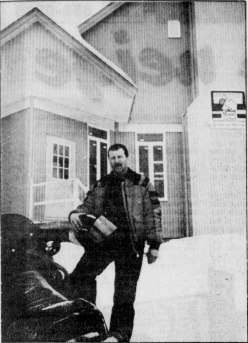
Le président du club de motoneigistes du Massif du Sud est très fier du chalet qui sera inauguré aujourd'hui.

Le Soleil était l'invité de l'Association touristique Chaudière-Appalaches.