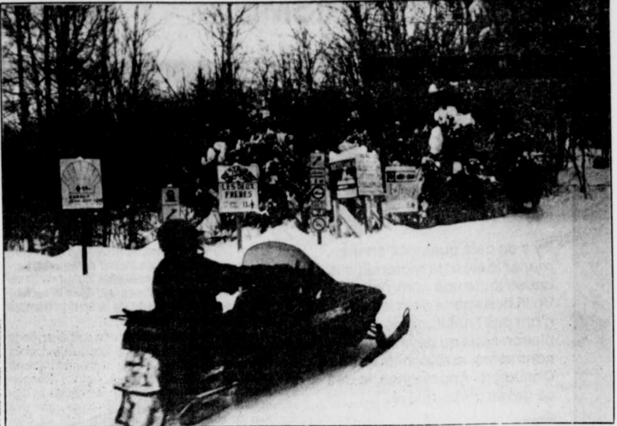
Même en plein bois, les indications sont nombreuses de sorte que les motoneigistes savent continuellement leur direction.

Il y a tout juste deux semaines, 133 motoneigistes ont, le même jour, pris le dîner à la station de ski. « Nous avons aménagé une