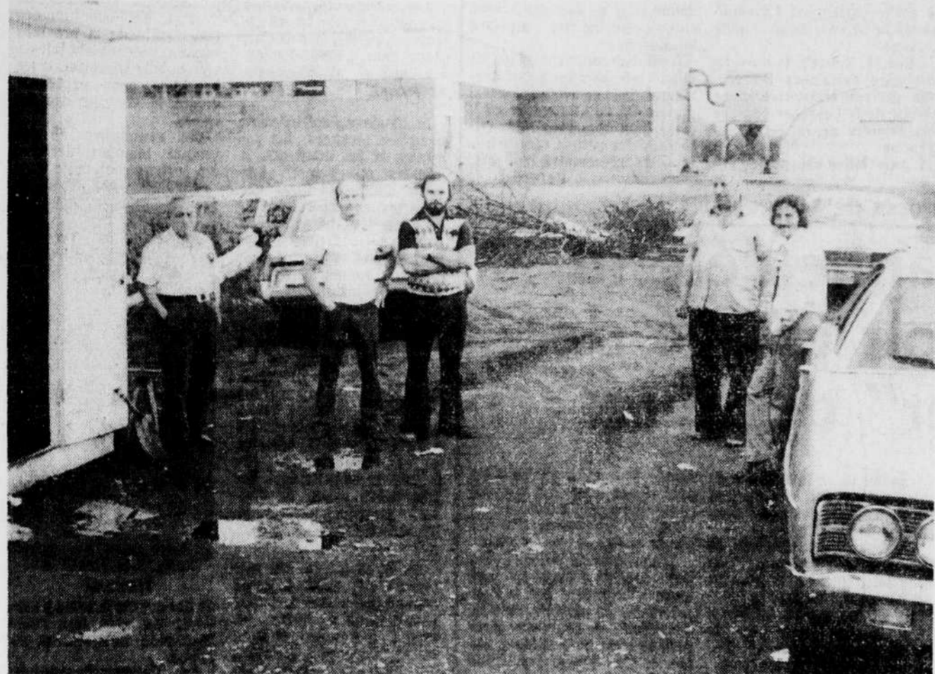
Quelques piqueurs à la fonderie Belgen. L'un des principaux points en litige, tout comme à la Général Manufacturière, porte sur les questions salariales...

Général Manufacturière, du local 7885 du syndicat des Metallos Unis d'Amérique, en faveur du maintien des