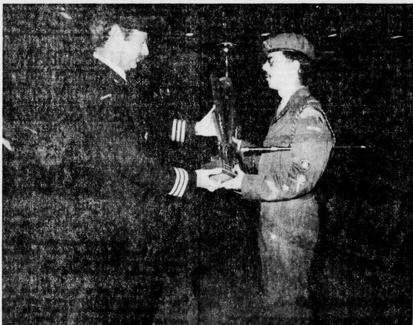
C'est en présence d'une centaine de personnes que le corps de cadet de Drummondville s'est vu remettre le trophée Lt-Col Deschamps, décerné au meilleur corps de cadet affilié au 6ème bataillon, par le St-Col Mariage.

la cérémonie, avec un salut au nouveau commandant, le capitaine M. Bourbeau. La soirée s'est terminée par une pièce de théâtre présentée par les jeunes du projet Alpha.