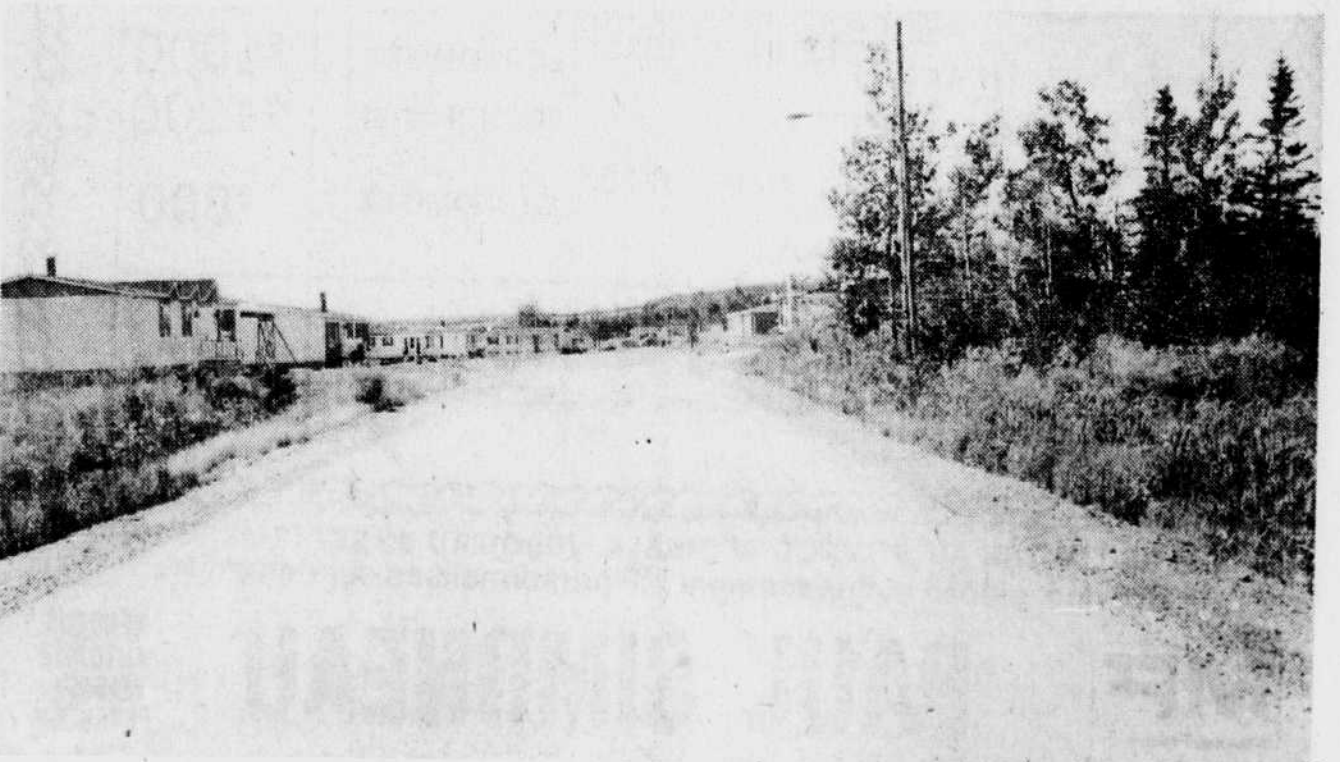
Des travaux de près d'un million de dollars devront être effectués dans le secteur Hamel, qui doit être

tomne commence dès demain... avec toutes ses couleurs formidables!