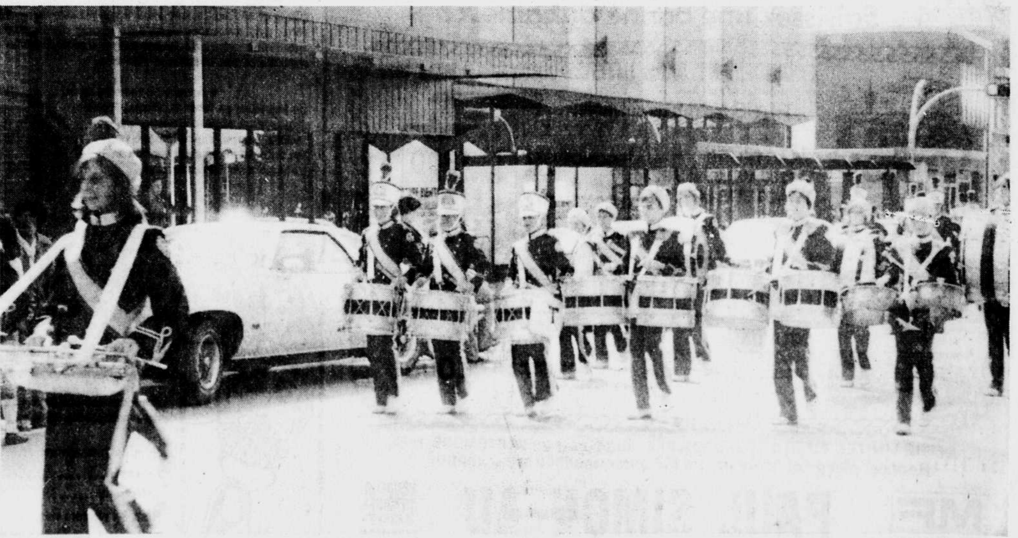
Une parade le long de la rue Notre-Dame a accompagné les Vulkins à leur première partie de Football, jouée sur le terrain du C.E.G.E.P. de Victoriaville hier après-midi.