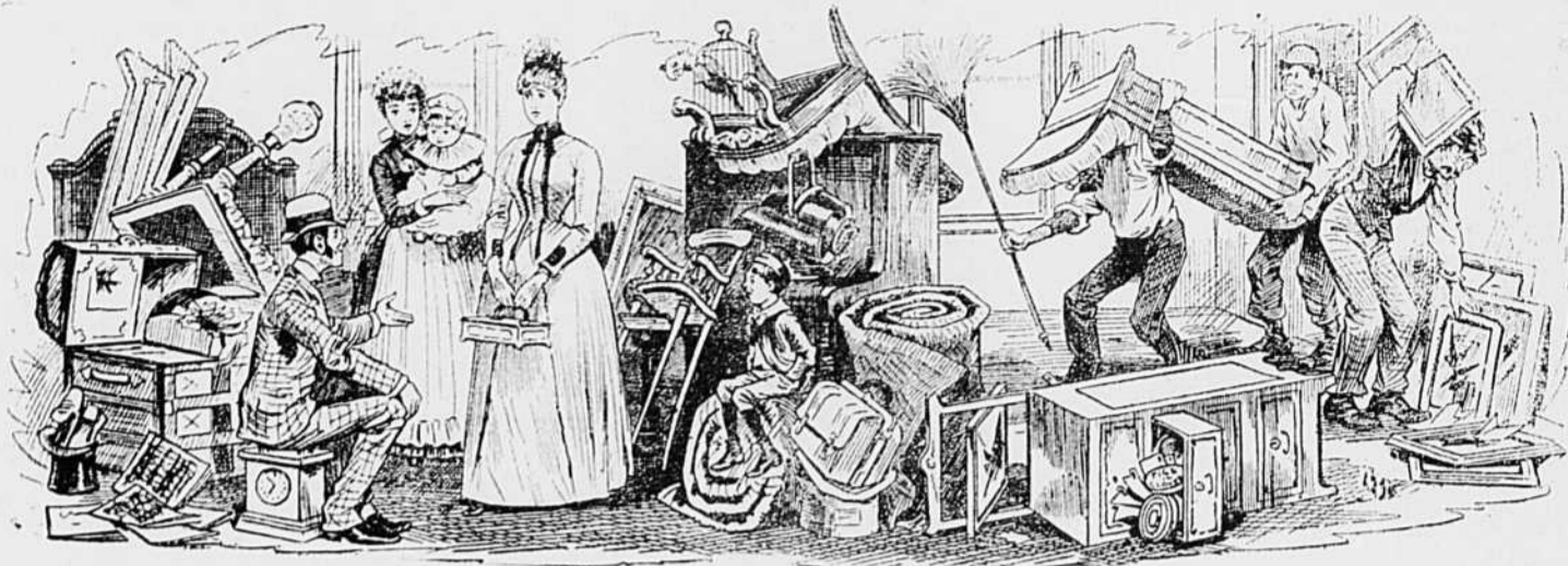
I Bouleau emménageant dans la maison que Rouleau vient d'abandonner. — Enfin nous voilà dans un appartement où ça vaut la peine de vivre ! Comment avons-nous fait pour persister deux ans dans la vieille grange de l'autre côté, avec ses fourmis et ses coquerelles ?