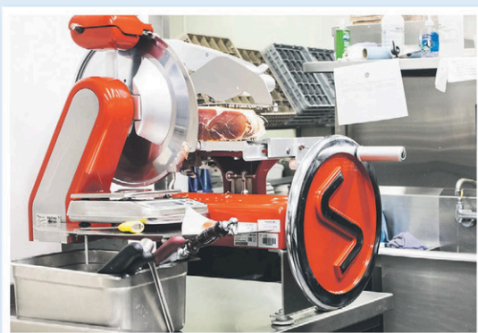
Nouvelle trancheuse manuelle à prosciutto.

À la suite des travaux de réaménagement de la cuisine de plus de 5 semaines (jour, soir et nuit) et avec la fermeture de 4 jours pour l'installation du nouvel équipement à la fine pointe de la technologie, toute l'équipe vous attend pour le plaisir de vos papilles.