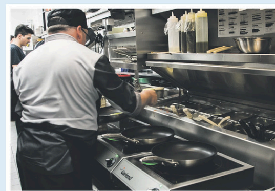
Coin à réchaud avec la technologie à induction au lieu de gaz.