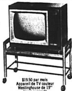
$19.50 par mois Appareil de TV couleur Westinghouse de 19" (avec support)

Nous vous prouverons, au moyen d'un essai GRATUIT à domicile, que si vous louez une télé-couleurs, vous bénéficiez de la meilleure aubaine qui soit.