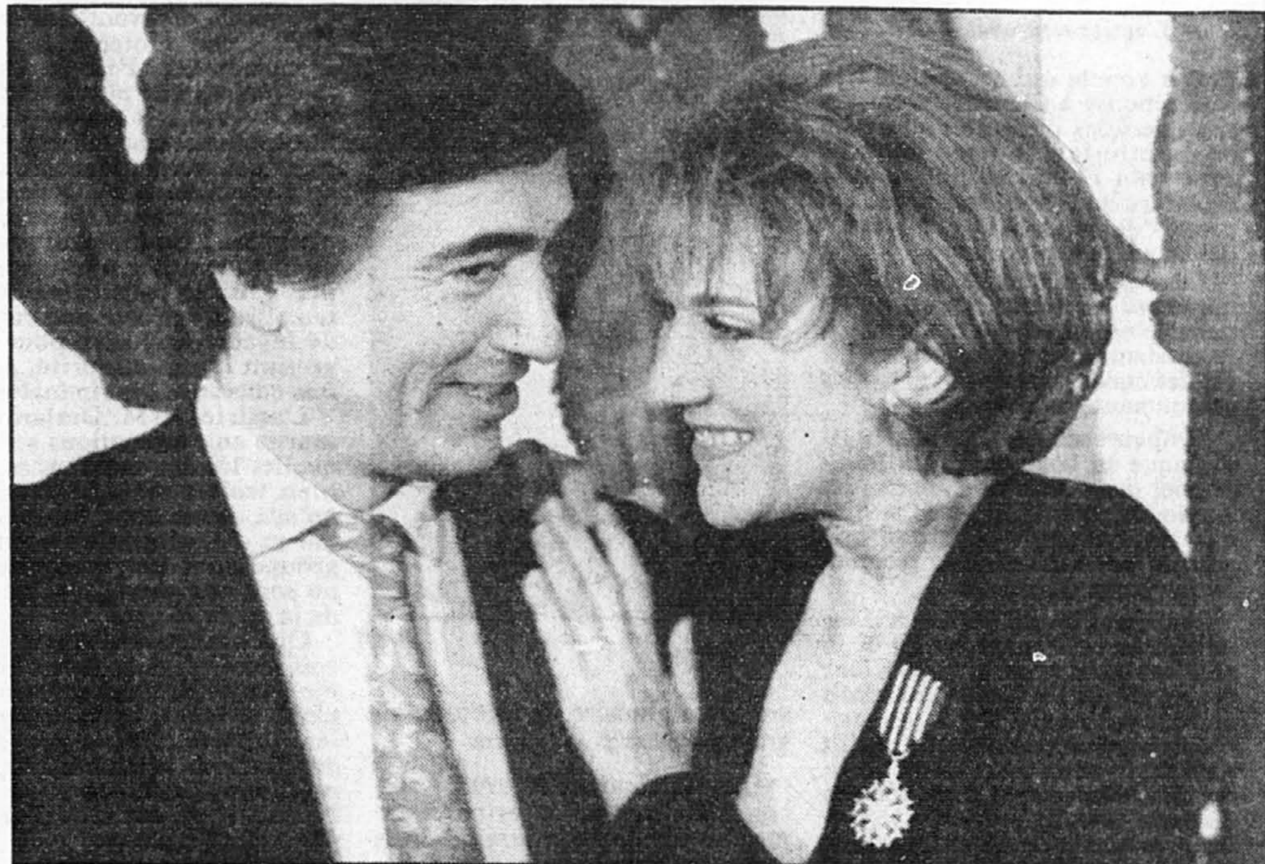
Le ministre français de la Culture, Philippe Douste-Blazy, félicite Céline Dion.

M. Douste-Blazy a remercié l'artiste « qui a permis à la culture française d'être mieux connue et appréciée dans le monde », saluant par ailleurs l'« exploit » qui a été le sien de vendre son dernier disque, D'eux , à 4,5 millions d'exemplaires dans le monde, dont trois millions en France.