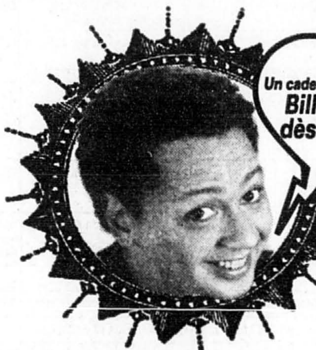
Normand Brathwaite Président de l'Assemblée