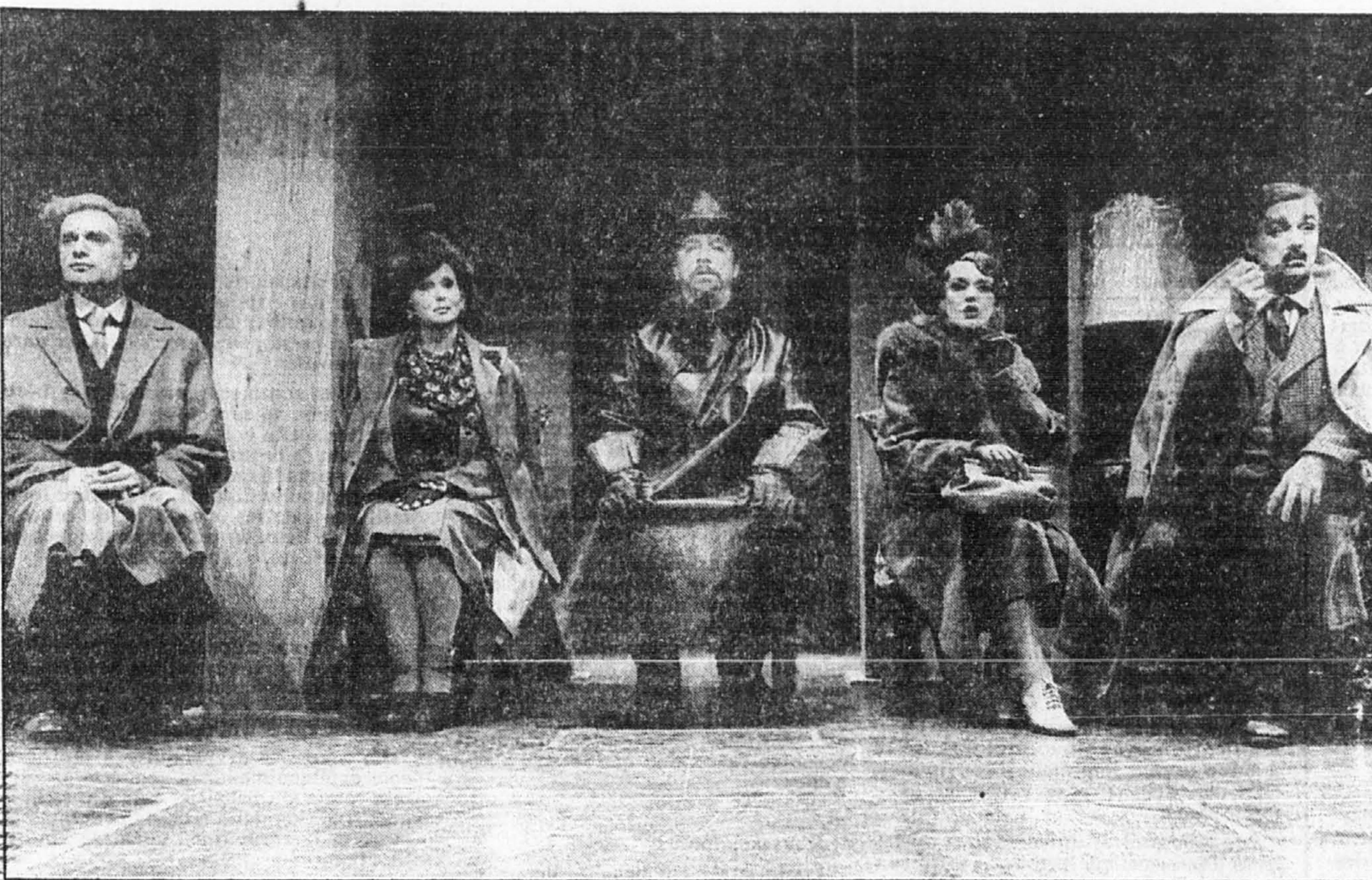
La Cantatrice Chauve