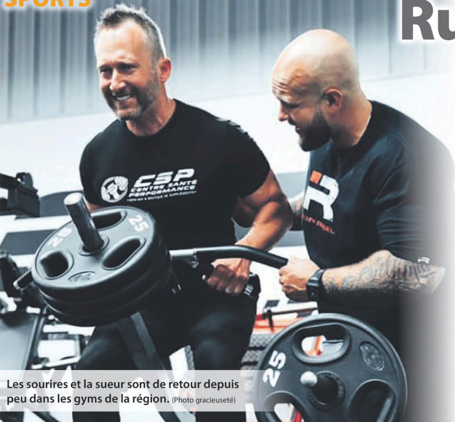
Les sourires et la sueur sont de retour depuis peu dans les gyms de la région.