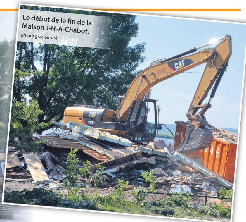
Le début de la fin de la Maison J-H-A-Chabot.