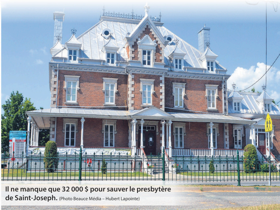
Il ne manque que 32 000 $ pour sauver le presbytère de Saint-Joseph.

Le ministère de l'Économie et de l'Innovation du Québec propose à la MRC de La Nouvelle-Beauce une deuxième enveloppe de 494 039 $ au Programme d'aide d'urgence aux PME de son territoire. Elle s'ajoute au contrat de prêt précédent, qui se chiffrait à 518 763 $ et qui est presque complètement utilisé. La MRC autorise Développement économique Nouvelle-Beauce à gérer cette seconde enveloppe de prêt selon les modalités convenues. Rappelons que cette aide financière s'adresse aux entreprises touchées par la pandémie de la COVID-19.