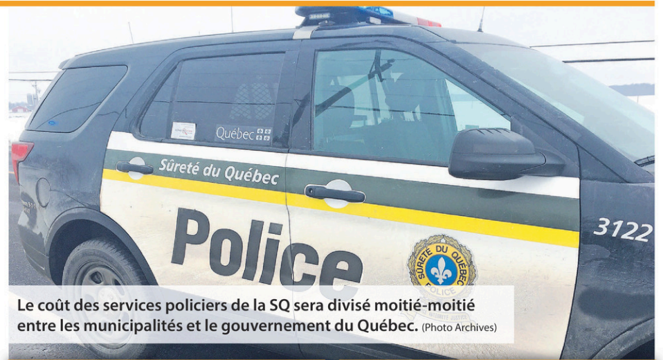
Le coût des services policiers de la SQ sera divisé moitié-moitié entre les municipalités et le gouvernement du Québec.

« Le statu quo aurait signifié une augmentation moyenne de 14% pour les municipalités en 2020. Nous avons travaillé pour trouver une solution durable à cette situation, qui devenait insoutenable. Dorénavant, il sera possible de planifier ce poste budgétaire important », espère Jacques Demers, président de la Fédération québécoise des municipalités (FQM).