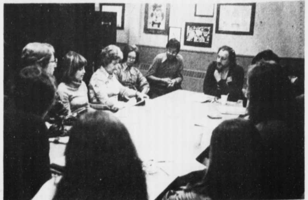
LES ATELIERS DE DISCUSSION se sont avérés extrêmement révélateurs et le conseil d'administration de l'organisme puise à profusion dans les recommandations émises afin que l'orientation colle de plus en plus à la réalité culturelle de notre municipalité (PHOTO LA REVUE)

Enfin au secteur de la programmation et de l'animation du Centre Culturel de Terrebonne, il devra établir une liste des événements culturels pour 1977 et participer à ces derniers, tout en diversifiant les manifestations et en élargissant le champ d'action couvert par le Centre Culturel de Terrebonne. Un des moyens précoces nous semble très important et intéressant, il s'agit de rejoindre les gens dans leur milieu de vie et de travail. On devra aussi mettre l'accent sur les manifestations de masse qui rejoignent à peu près tout le monde et créent Par leurs caractères communautaires des liens d'appartenance à la collectivité. Enfin, les participants soulèveront le problème de l'organisation d'activités pour les 13-16 ans, ce sur quoi le Centre Culturel de Terrebonne devra se pencher et essayer de trouver des secteurs et des formes d'activités susceptibles