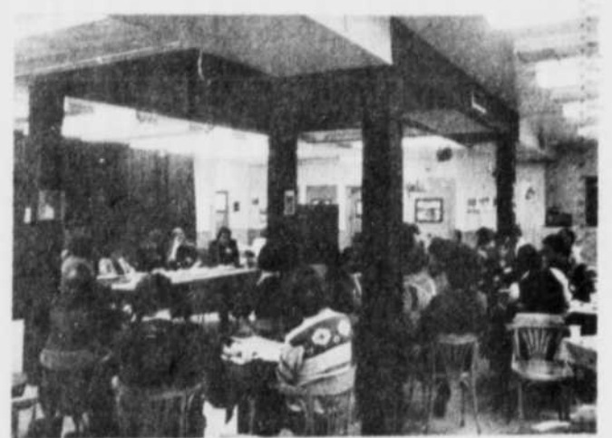
ENVIRON 70 PERSONNES sont venues participer à l'assemblée générale annuelle du centre culturel de Terrebonne qui s'est tenue à son siège social le 19 janvier dernier.

d'intéresser cette classe d'âge qui veut s'affirmer à sa façon. En résumé, nous pouvons affirmer que cette réunion générale donna l'occasion aux dirigeants du centre et aux participants de se rendre compte que l'organisme se mérite de plus en plus la faveur de la population et que la population mérite un Centre Culturel.