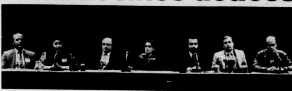
Les représentants des différentes thérapies naturelles ont discuté de l'avenir de leurs disciplines au Québec.

La situation est tout aussi confuse sur le plan pédagogique. Encore ici, les chiropraticiens font bande à part. Leur formation est reconnue, mais elle est dispensée uniquement en dehors du Québec. Le ministère