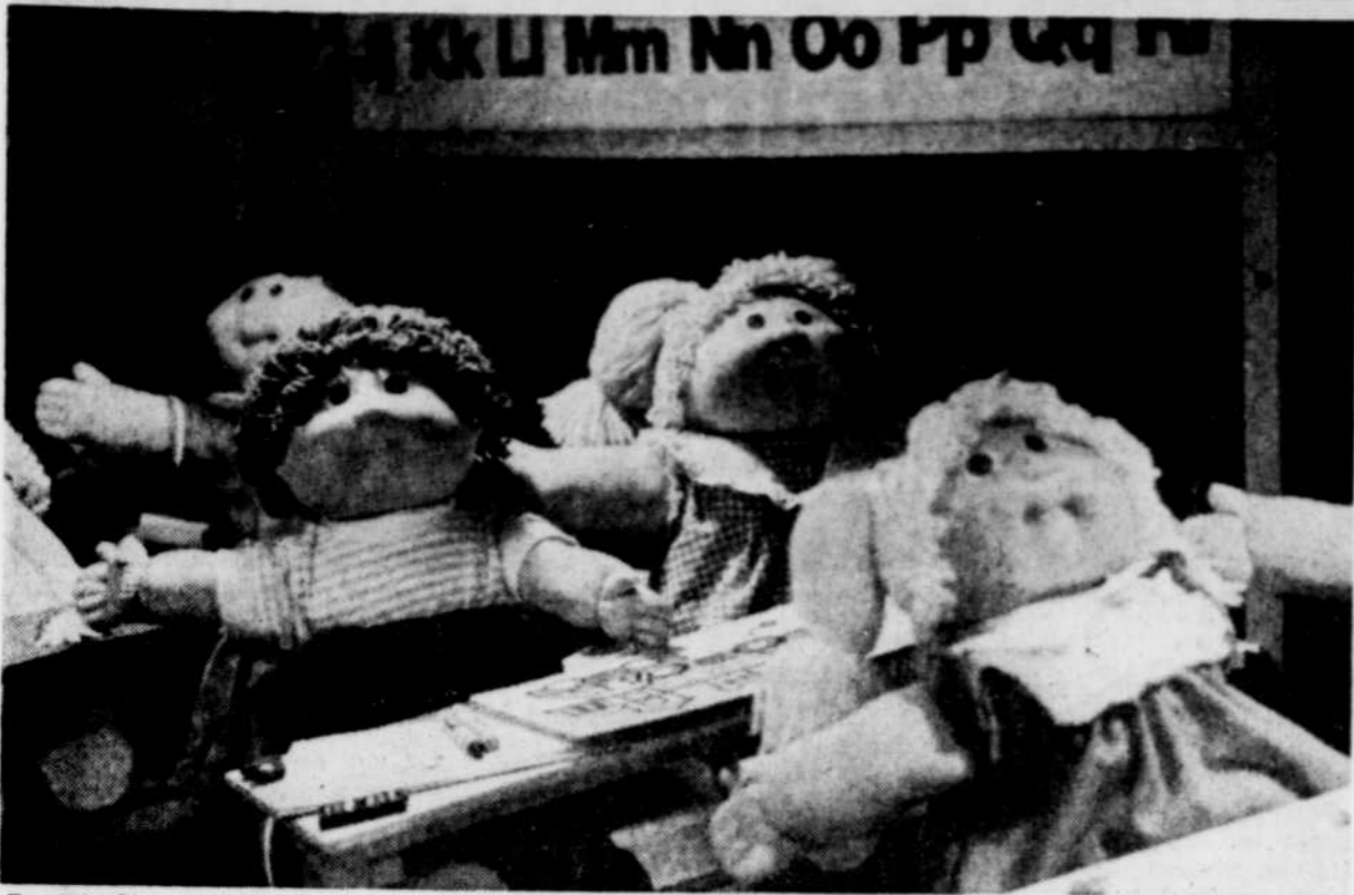
Bout de Chou va à l'école.