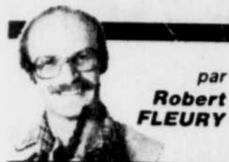
par Robert FLEURY

l'assuré avait fait de fausses déclarations. Or, la preuve révéla le contraire et le juge condamna la compagnie d'assurance à verser l'indemnité convenue. Jugement no 350-05-00001-840, cour supérieure, District de Beauce.