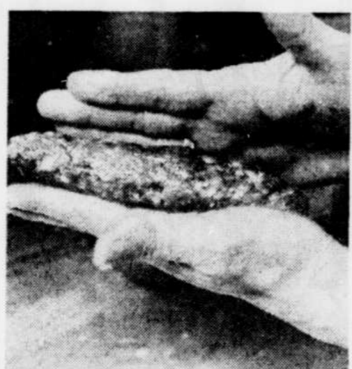
Séparer la préparation en six portions qui sont roulées dans les mains pour prendre la forme d'un gros doigt ou d'une saucisse.