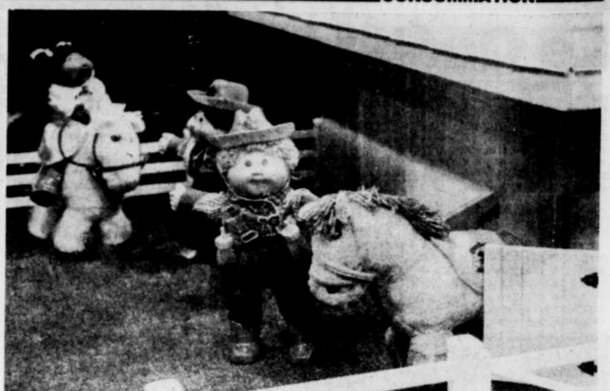
Bout de Chou en tenue d'équitation. Les chevaux aussi se vendent.