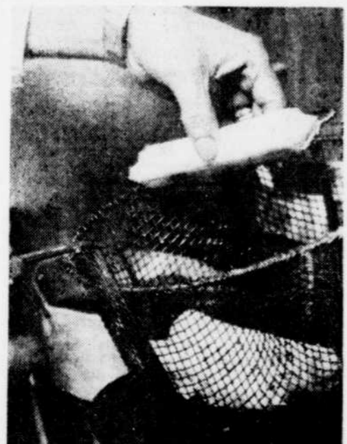
Faire frire les doigts de Fatima dans l'huile chaude pendant cinq minutes.