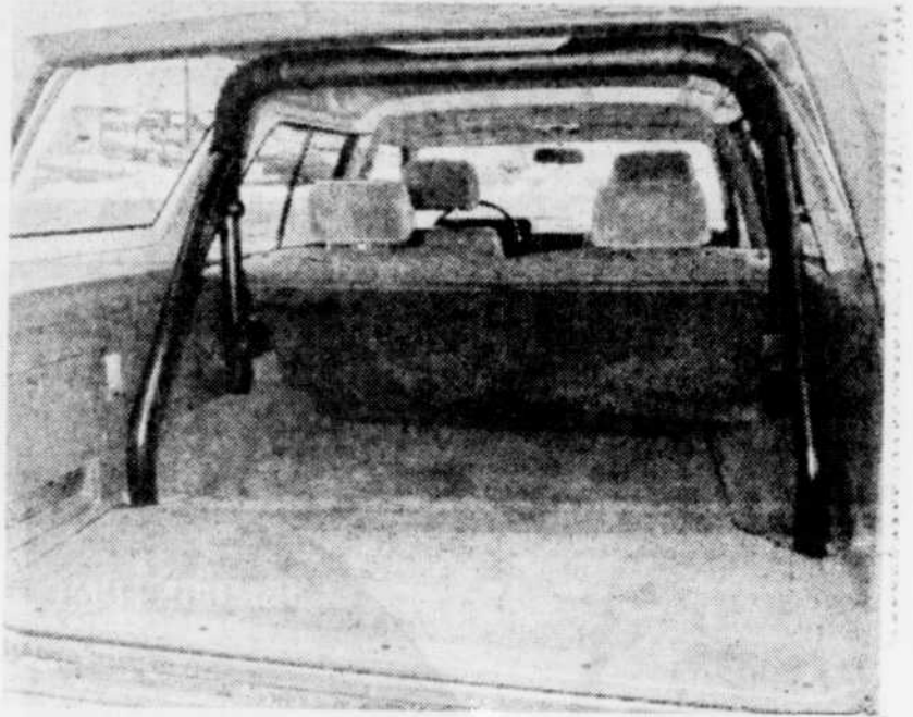
L'espace à bagages est volumineux et on trouve un arceau de sécurité juste derrière le siège arrière.