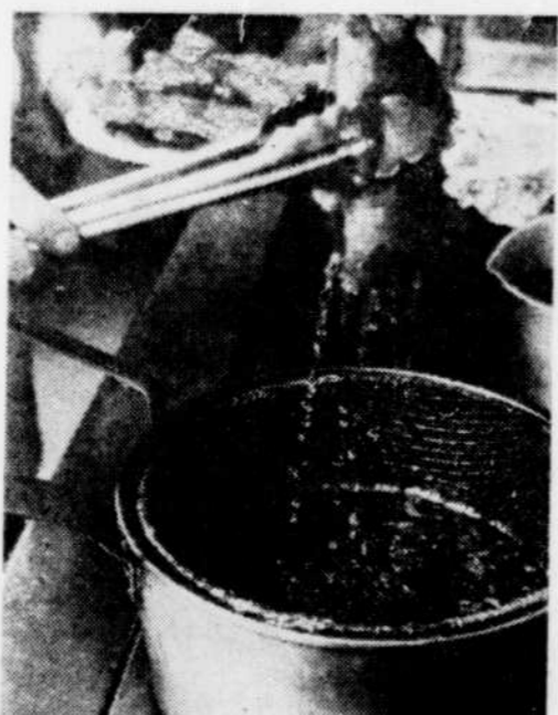
Laisser égoutter les doigts de Fatima après la cuisson.