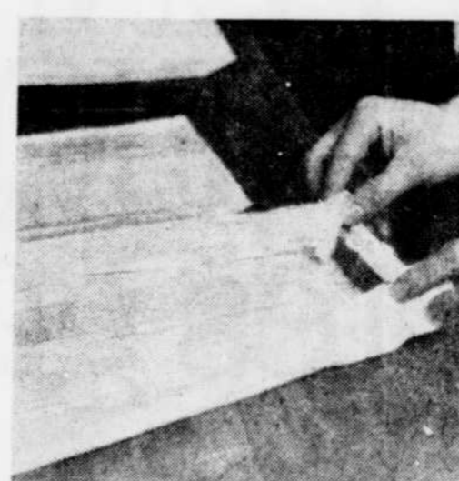
Enrouler chacun des doigts dans une feuille de pâte feuilletée coupée en deux dans le sens de la longueur.