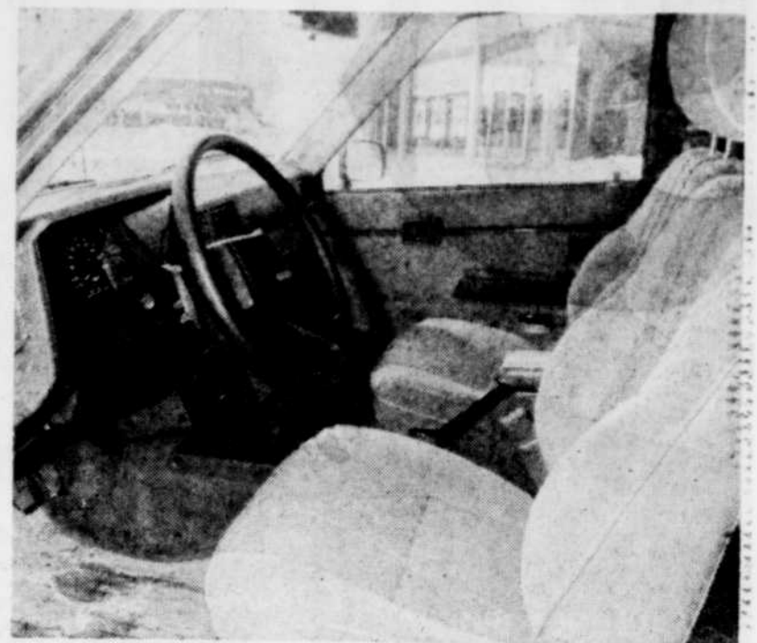
Toyota a aménagé l'intérieur de brillante façon et les sièges sont confortables.

par l'Automobile & Touring Club du Québec (collaboration spéciale)