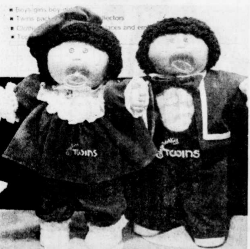
Bout de Chou a un frère jumeau... ou une soeur jumelle cette année!