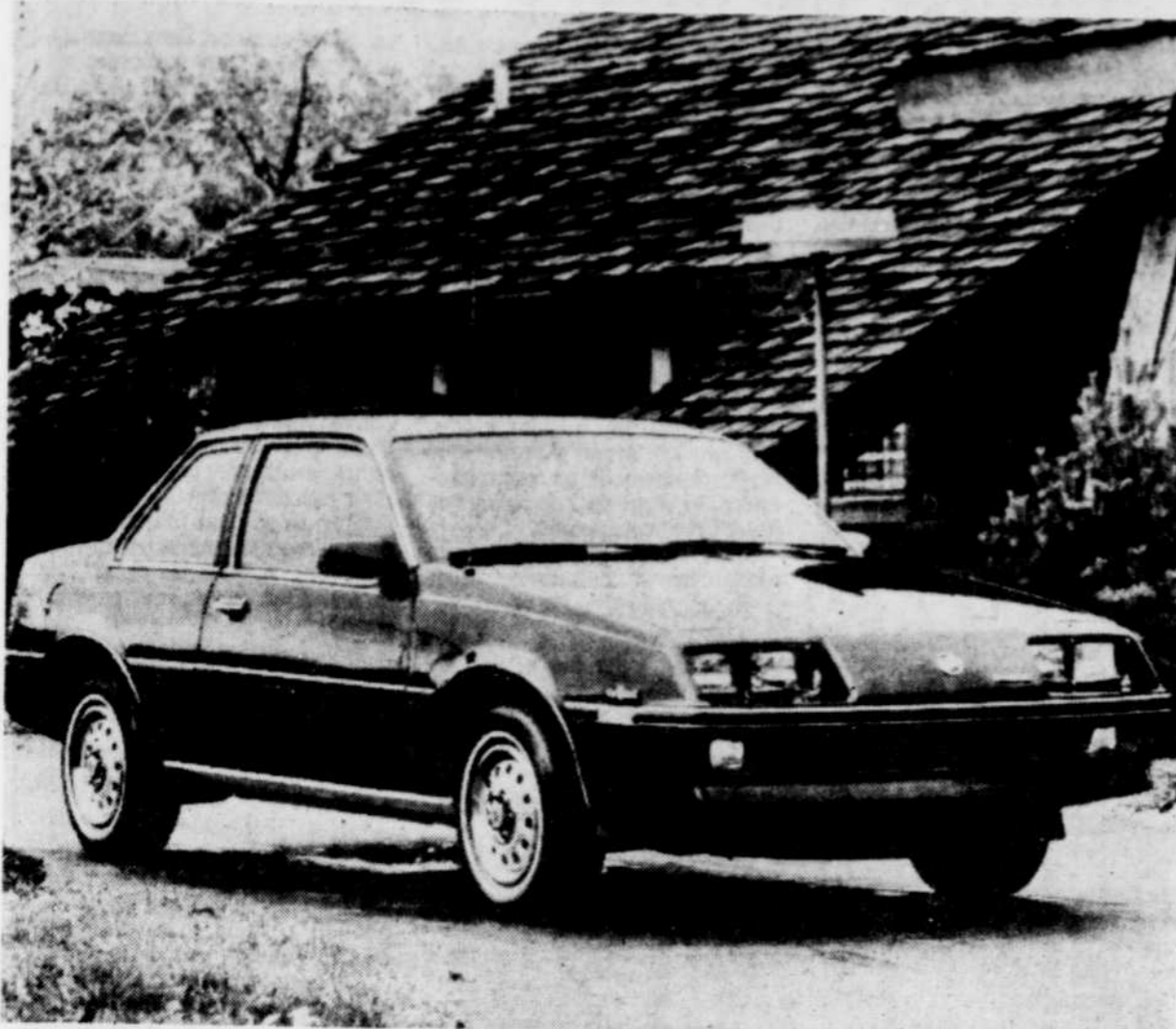
Le propriétaire d'une grosse voiture peut tirer un bon prix de revente.

◆ Depuis mars 1984, il en coûte 4 pour 100 de plus pour utiliser une automobile de petit modèle, alors que les propriétaires de voitures de plus grande taille déboursent 3 pour 100 de moins.