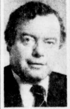
M. Robert-René de Cotret