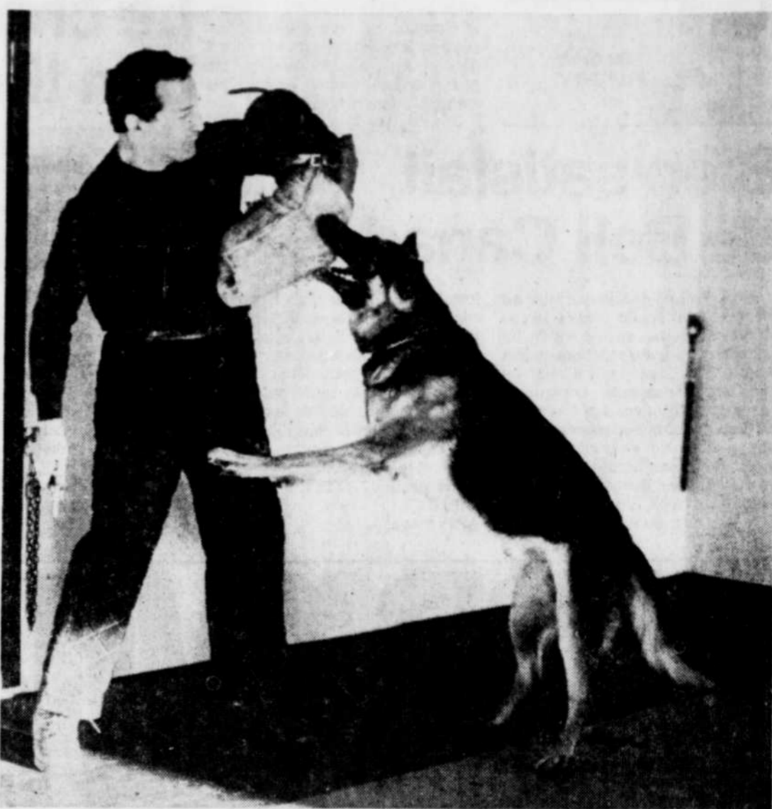
Ces chiens, dressés spécialement pour la protection, développent une antipathie féroce pour les visiteurs non souhaités. Ils subissent un entraînement approprié.

Evidemment, ces chiens sont chers. Pour un chien bien dressé, vacciné, il faut compter investir au