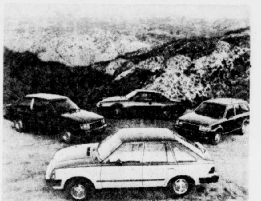
La dépréciation des petites voitures a beaucoup changé depuis l'an dernier.

Aujourd'hui, les consommateurs recherchent particulièrement des modèles intermédiaires, dont l'entretien et l'utilisation entraînent des coûts raisonnables, mais aussi parce que ces modèles leurs assurent plus de sécurité.