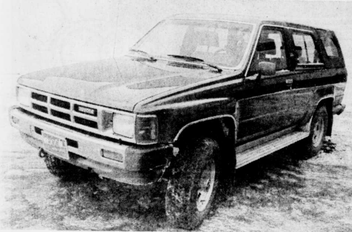
La qualité de la finition et de l'assemblage de ce Toyota est excellente tant à l'intérieur qu'à l'extérieur.