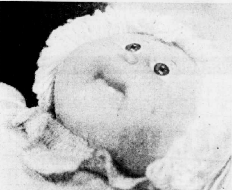
Tiens, bébé Bout de Chou vient de percer une dent!