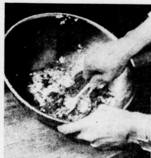
Mélanger tous les ingrédients dans un grand bol.