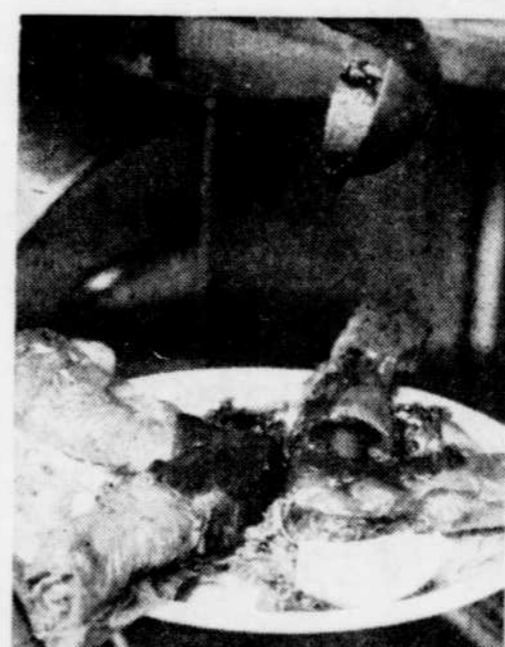
Servir sur un nid de riz et bien napper le tout d'une sauce tomate.