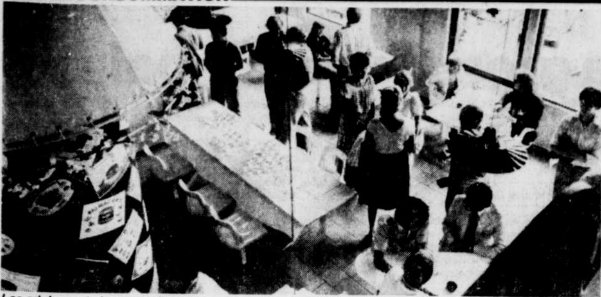
Les adolescents forment près de la moitié de la clientèle des restaurants-minutes.