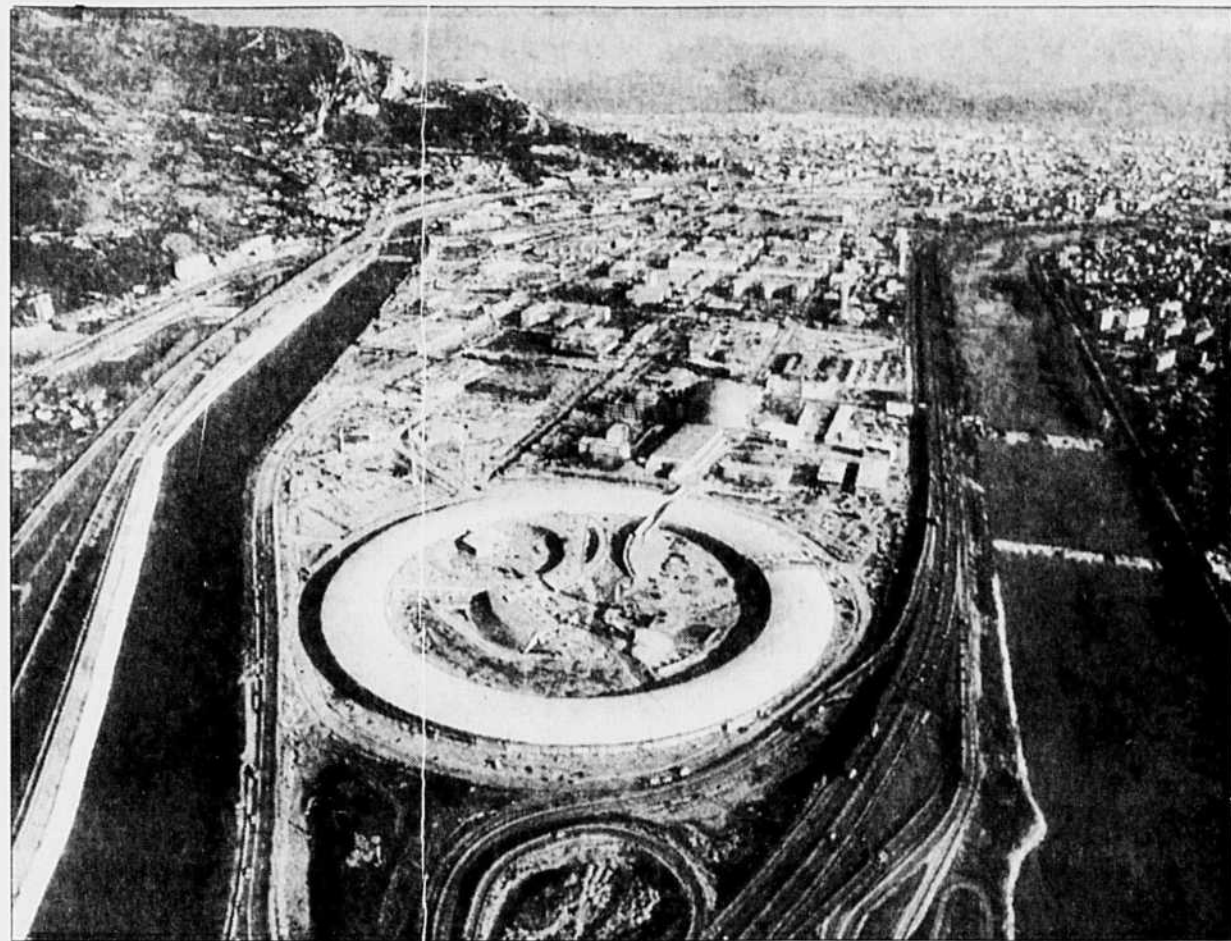
lement artificielle encore à créer.

Les Européens pourraient cependant bénéficier d'un répit supplémentaire, car l'APS semble en butte à des difficultés budgétaires et le SP-8 à des problèmes de site, les Japonais ne sachant pas encore s'ils le construiront autour d'une colline qu'il faudra en partie niveler ou au sein d'une cité technologique tota-