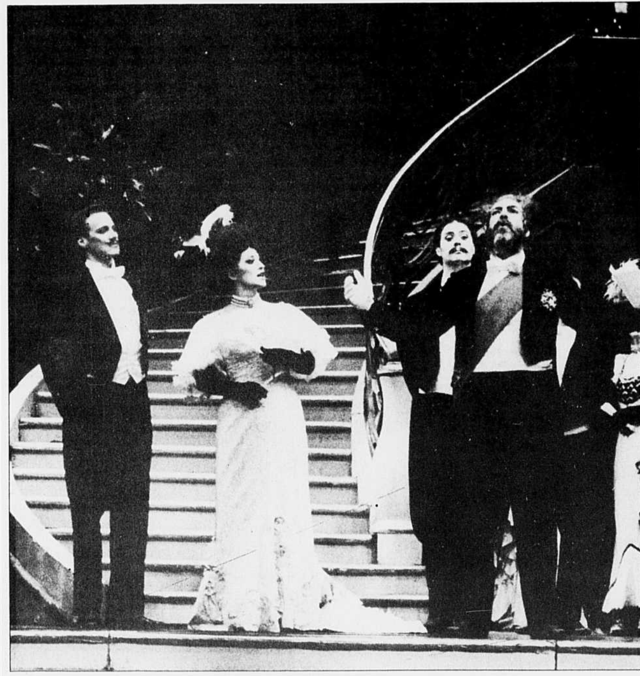
Un extrait du premier acte de La Veuve joyeuse , présenté par l'Opéra de Montréal.