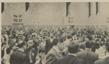
Une foule nombreuse évaluée à près de 1,000 personnes a participé activement à ce congrès extraordinaire. Sur cette photo on voit une partie de l'assistance au cours des débats.

Les congressistes ont pu apprécier l'excellente organisation du congrès qui contribua à créer un climat de détente facilitant ainsi les importantes discussions.