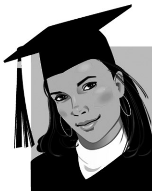
Photo de votre graduée et votre message à partir de 35,00$. 613-562-0222