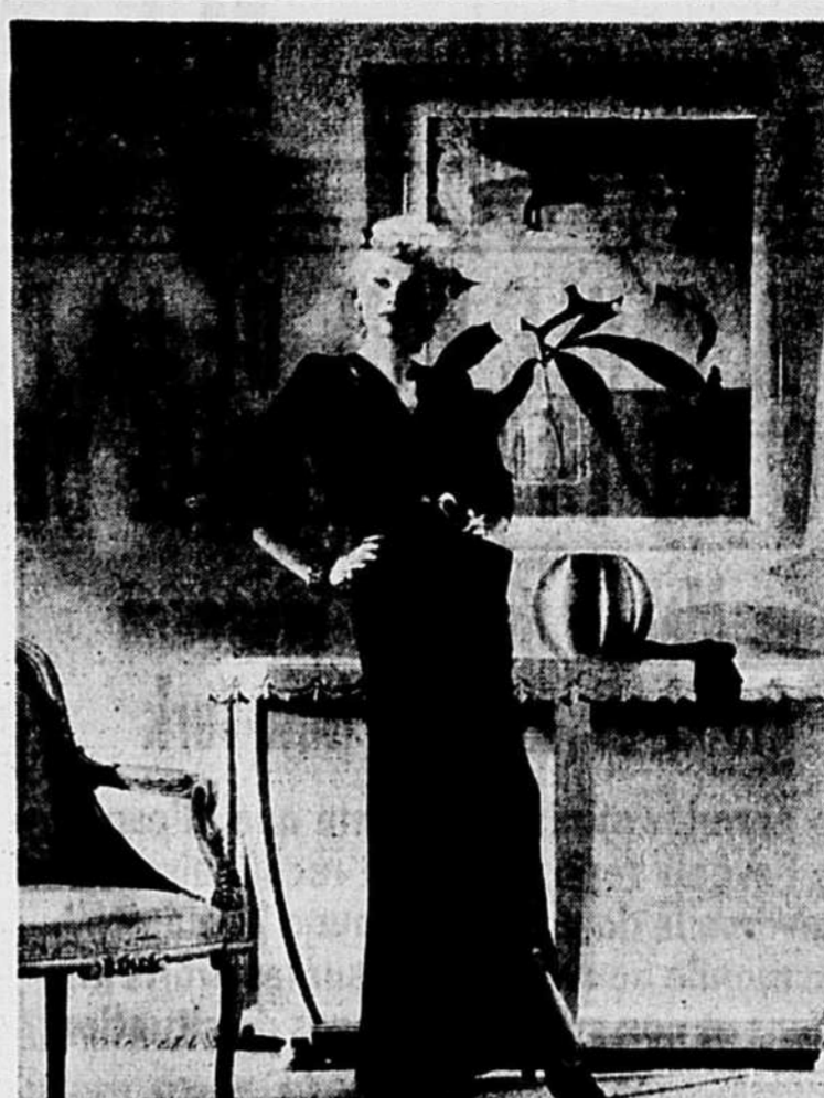
Elegante robe de dîner qui rehausse le charme exquis de la blonde Lucille Ball, artiste de la RKO. Ce modèle est en crêpe noir épais, à corsage drapé très ajusté. La jupe également drapée donne l'impression de la nouvelle ligne populaire "peg-top". Remarque: l'ouverture au bas pour faciliter la marche. La taille est soulignée d'une étroite ceinture en chevreau doré. Mlle Ball harmonise l'ensemble avec un bracelet-chaîne, une épingle et des boucles d'oreille dorés. Ses sandales sont en velours noir ainsi que la boucle qu'elle porte dans ses cheveux.

A la chapelle du Sacré-Coeur, coin des Rachel et de Borden, le R. P. Joseph Ledit, s.j., prêchera un grand triduum préparatoire à la fête de l'Immaculée-Conception, samedi, dimanche et lundi, les 5, 6 et 7 décembre, à 7 h. 30 du soir. Mardi, le 8 décembre, journée de la fête, à 7 h. 30, aura lieu la clôture solennelle du triduum.