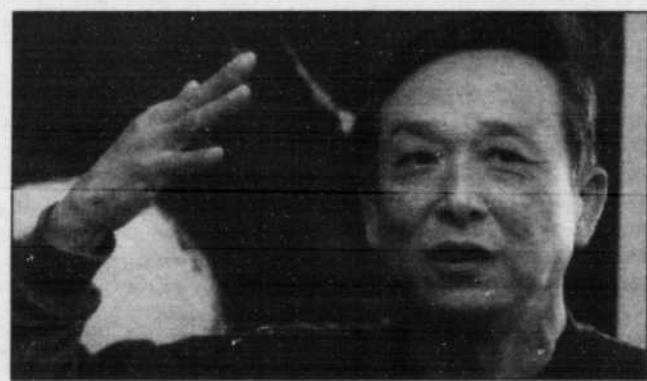
Un hommage est rendu au Prix Nobel de littérature Gao Xingjian.

Dans ce cadre, un hommage est rendu au Prix Nobel de littérature Gao Xingjian avec la mise en scène de quatre pièces et une exposition-rétrospective au palais des Papes de l'œuvre peinte inédite de cet auteur de langue chinoise.