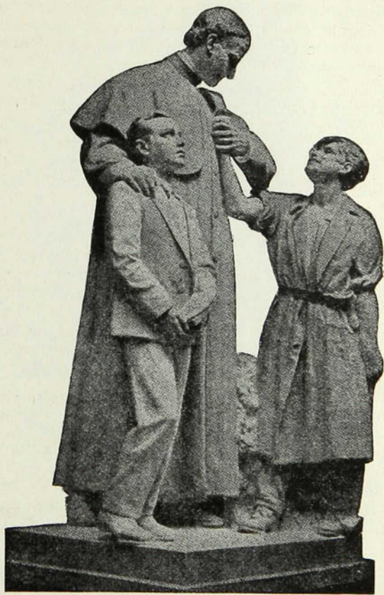
Un saint éducateur DON BOSCO