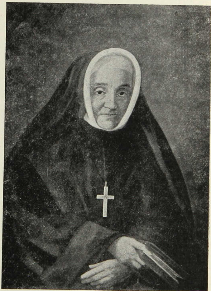
MÈRE MARIE-ANNE fondatrice des Sœurs de Sainte-Anne