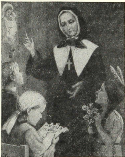
LA BIENHEUREUSE MARGUERITE BOURGEOYS fondatrice des Sœurs de la Congrégation de Notre-Dame

consumer, peut parfois faiblir. Il est donc important pour les éducateurs de méditer souvent sur la grandeur de leur rôle qui les associe à la paternité même de Dieu et à son amour bienfaisant pour la créature et en particulier pour la jeunesse. Cette contemplation souvent répétée pourra rallumer ou raviver cette charité qui doit nous faire dire comme Notre-Seigneur: « Laissez venir à moi les petits enfants 1 . »