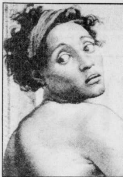
Vue partielle d'une peinture de Michel-Ange.

Tout ce petit monde doit cohabiter, le festival officiel éclatant, avec ses 250 représentations, sa vingtaine de concerts dans 28 lieux, dans et hors la ville, en fin d'après-midi et en soirée, et le « off » se répartissant dans plus de 80 locaux où l'on joue de la fin de la matinée à minuit.