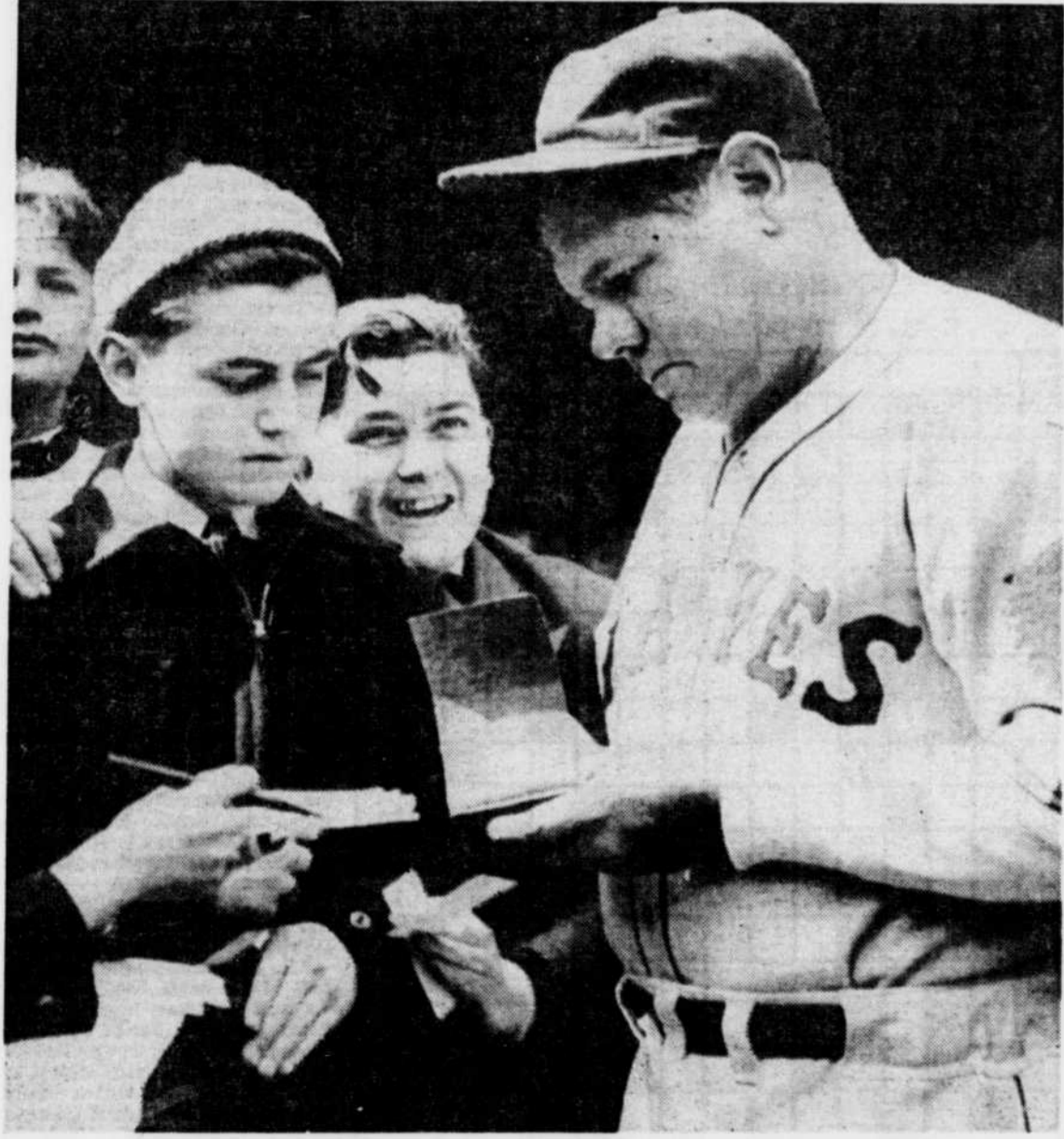
En 1934, Babe Ruth a frappé son 700e coup de circuit dans une victoire de 4-2 au dépens de Tommy Bridges et des Tigers de Detroit. La balle a passé par-dessus le mur du champ droit et elle a roulé quelque centaines de pieds dans la rue menant au Stade Briggs.