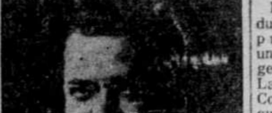
M. Dudley L. Simms, qui vient d'être élu président national des clubs Lions, comptant 577,000 membres, répartis dans 91 pays.