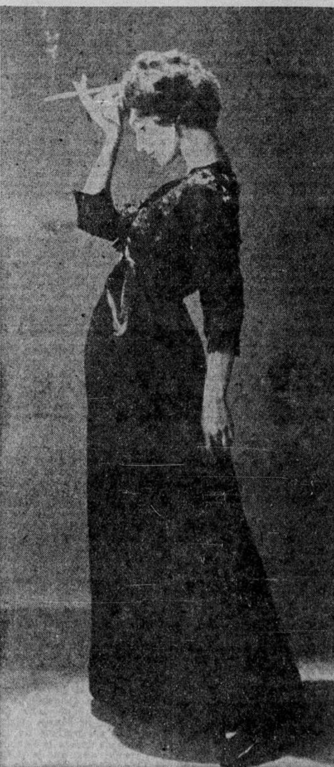
Même si les "incroyables" ne reviennent pas, la ligne Directoire apparaîtra le soir comme dans cet ensemble dessiné par Bill Blass pour la collection d'automne de Maurice Rentner: un boléro de dentelle noire brodée de marguerites de satin noir pour accompagner une robe de bal, pleine longueur, c'est-à-dire qui descend sur le pied.