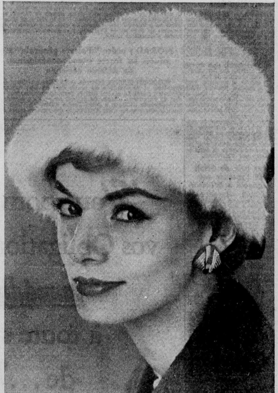
Le shako de feutre mousse blanc neige sera encore dans le paysage nordique, l'hiver prochain. Fort heureusement, ce modèle-bien coiffant est tout indiqué, quand le vent du nord court les chemins en compagnie du bonhomme hiver. C'est un modèle de Walter Florell, inspiré par l'Empire, dit-on et dont la silhouette haute est accentuée à l'arrière par un noeud de velours noirs.