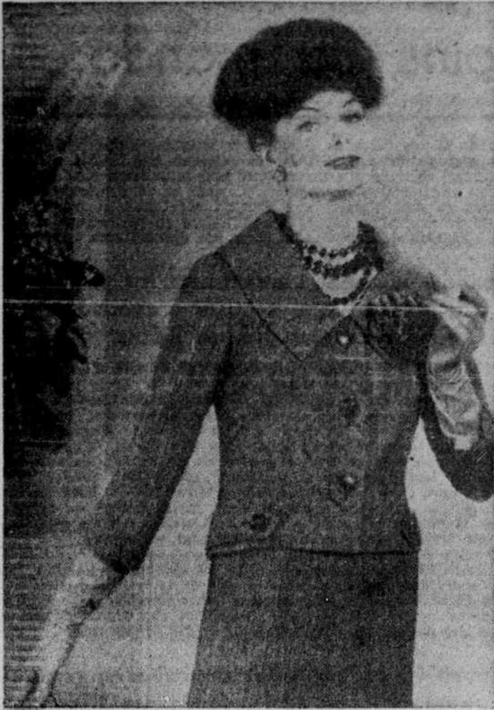
LA MODE A NEW-YORK. — Ce costume de tweed de laine et de soie beige et brune, a été dessiné par Copeland pour la collection d'automne de Pattullo-Copeland. La jaquette, très courte, de ligne droite comme la marinière, a de brèves ceintures de chaque côté et une encolure à col très dégage.