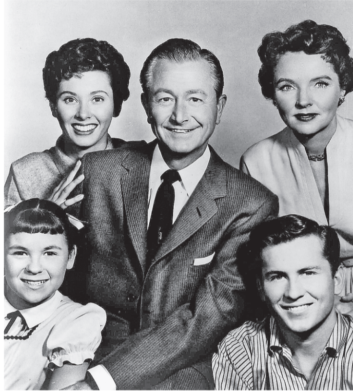
La famille de Papa à raison, série culte de la fin des années 50. Robert Young a joué le rôle du père plus straight qu'un poteau de téléphone.

Le parcours père-fils de Luke Skywalker et de son père Anakin/Darth Vader, les personnages centraux de la Guerre des étoiles , fut pour le moins houleux. En basculant du côté sombre de la force, Vader contraignit son fils à risquer de furieux combats dans un vaisseau spatial, à brandir le sabre laser (il en aura même une main coupée), à faire