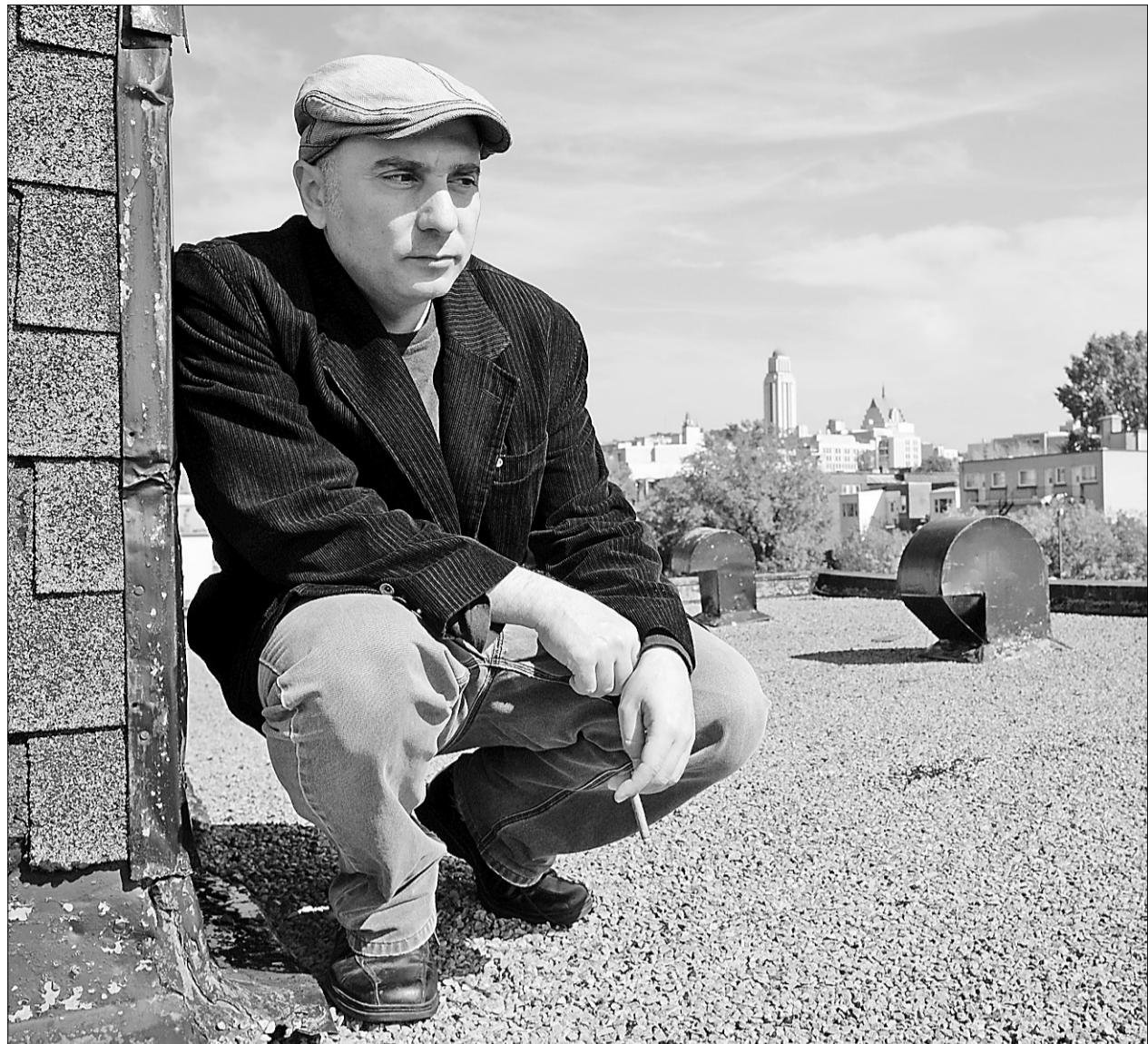
Rawi Hage a remporté l'International IMPAC Dublin Literary Award, un des plus prestigieux et des plus généreux prix du monde littéraire, doté d'une bourse atteignant près de 160 000$.