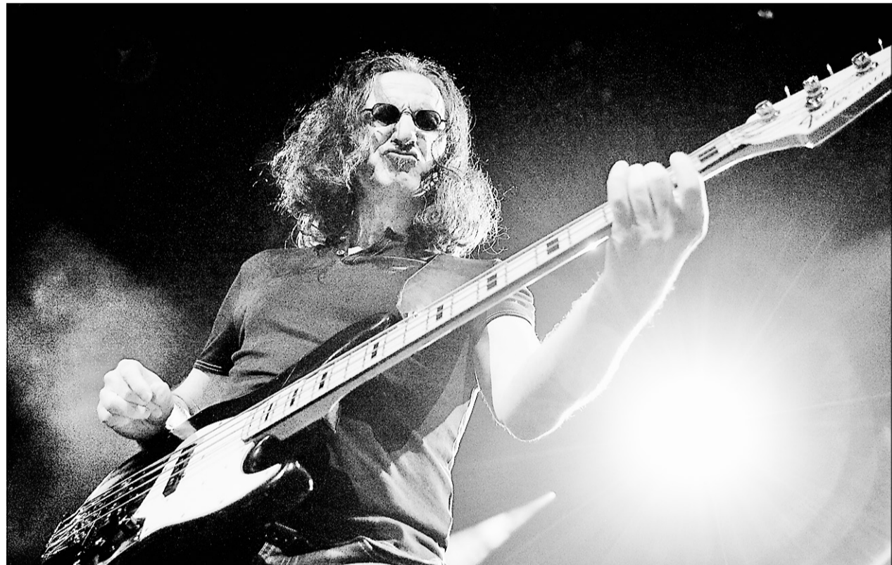
Geddy Lee (photo) et Rush ont fait preuve de générosité envers leurs fans réunis hier au Centre Bell.

À vif dans le sujet avec le succès Limelight , extrait de Moving Pictures , l'album définitif de Rush, enchaînant ensuite avec Digital Man (l'album Signals , 1982) et Ghost of a Chance ( Roll the Bones , 1991), qui