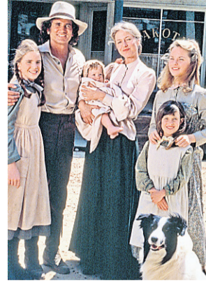
Charles Ingalls, joué par Michael Landon.