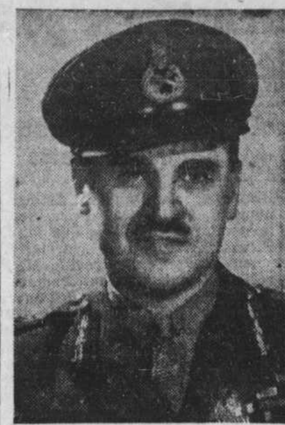
4325-1 Voici une récente photographie du major-général A. E. Walford, C.B.E., M.M., E.D., adjudant général de l'Armée canadienne. 24-12-45

De la lecture pour toute l'année La Ruche littéraire septembre 1944 à juin 1945 inclusivement. Beau volume de 325 pages abondamment illustré, format 6 1/2 x 9 3/4, reliure pleine toile. Au comptoir $1.25, par la poste $1.40. SERVICE DE LIBRAIRIE DU "DEVOIR"