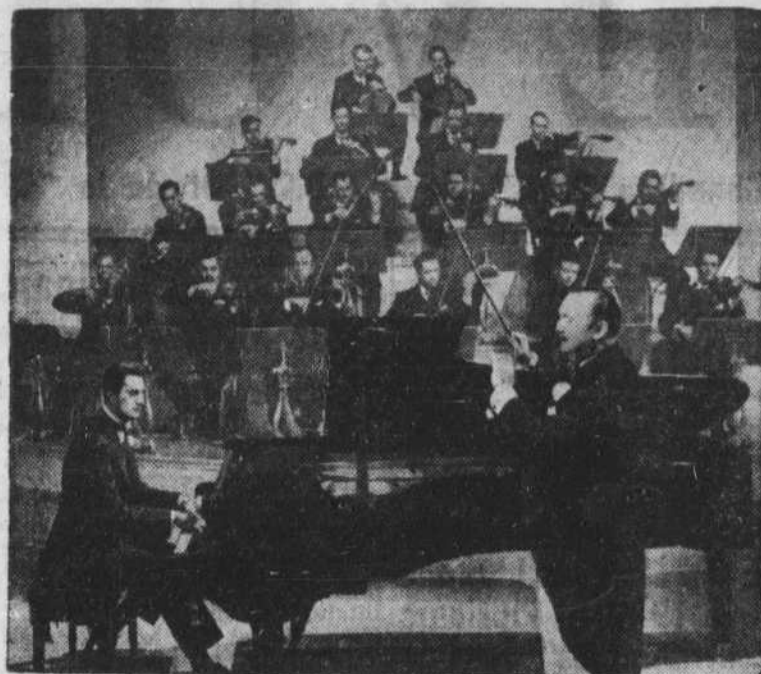
Une scène du film "Rhapsody in Blue", qui passe à l'affiche du cinéma Loew's, cette semaine.