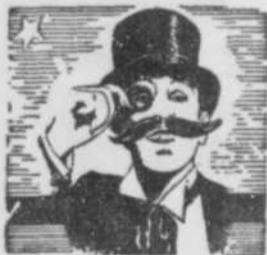
— PAR — L'ACADEMICIEN