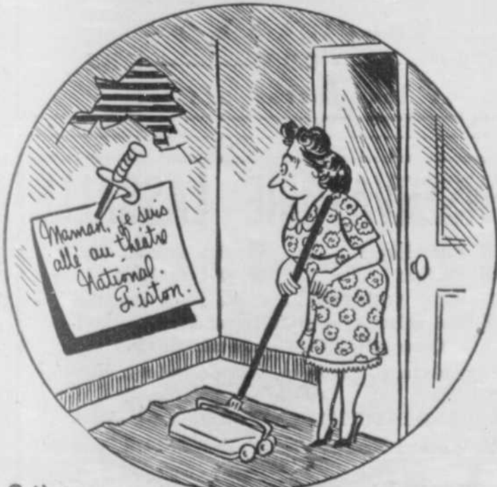
QU'À L'ÂGE DE DOUZE ANS, ALYS ROBI JOUAIT COMME CHANTEUSE ET COMÉDIENNE AU THÉÂTRE NATIONAL ET CELA PENDANT UNE PÉRIODE DE 75 SEMAINES?