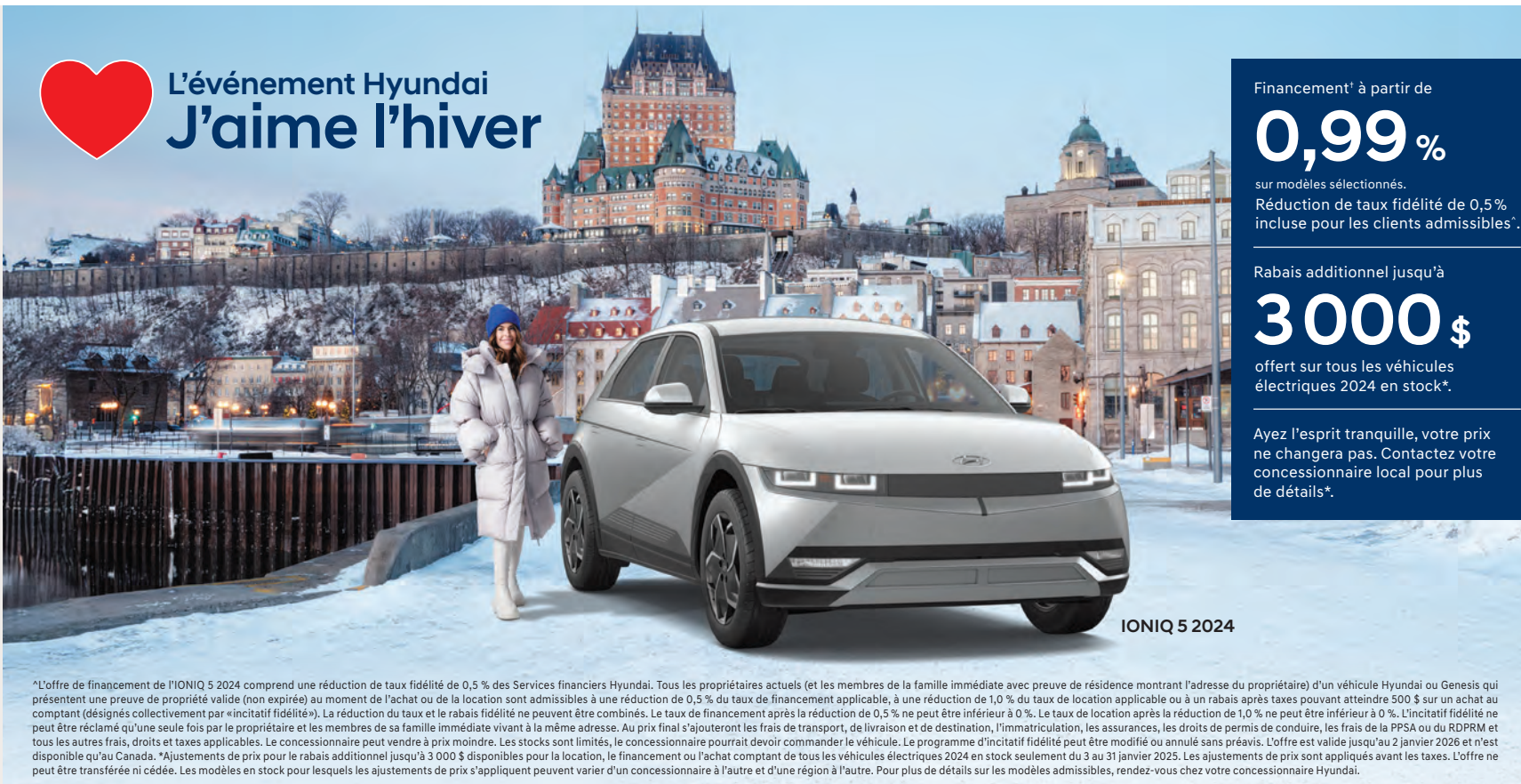
IONIQ 5 2024