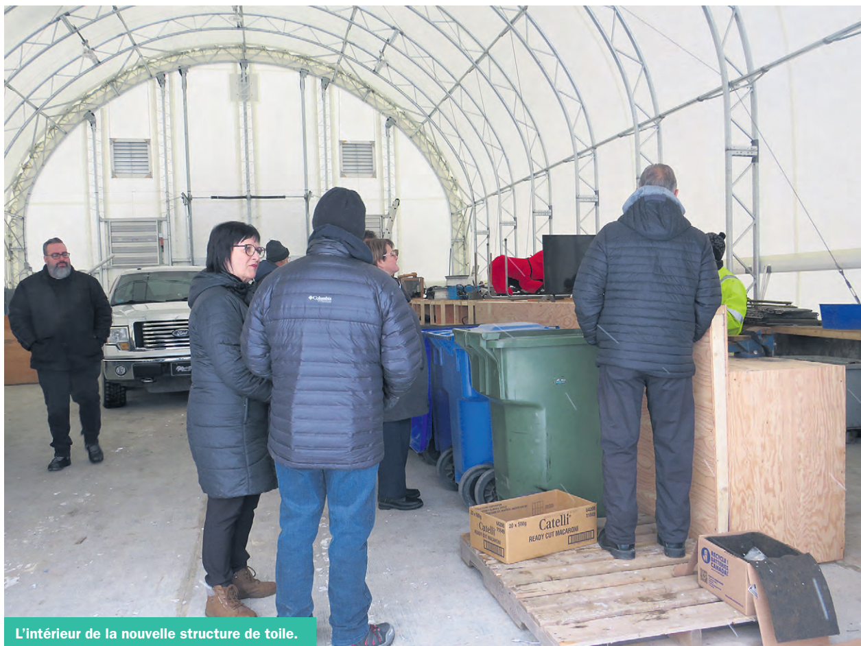
L'intérieur de la nouvelle structure de toile.

L'Écosite de La Matapédia est un organisme à but non lucratif dont la mission est de revaloriser un maximum de matières récupérables au moindre coût pour les citoyens de la MRC de La Matapédia et de créer de l'emploi dans la région.