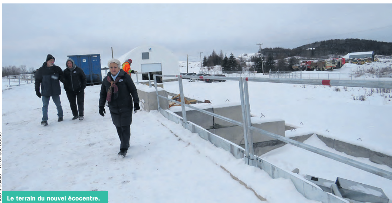
Le terrain du nouvel écocentre.