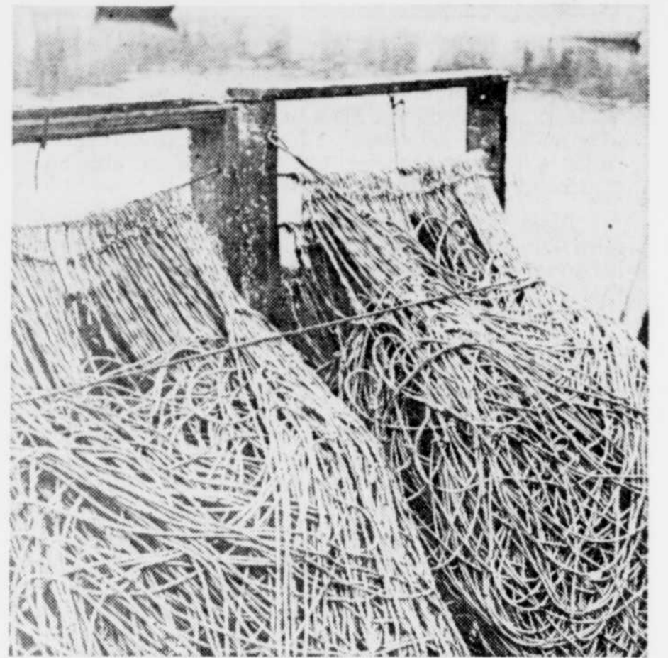
Chaque filet, avec ses ancrages et ses bouées, revient à près de $300 et environ 55 filets ont été endommagés dont seulement le dixième peut être réparé.

"Chaque filet, avec ses ancrages et ses bouées, revient à près de $300. Si la pêche au hareng est aussi bonne à l'automne qu'au printemps, nous pourrions nous réchapper et "boucher pas mal le trou".