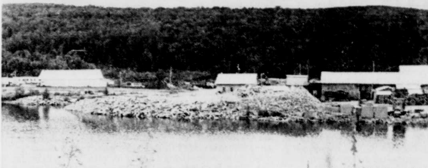
Selon le conseil municipal, au cours des 18 derniers mois, les résidus de coupe de granit de l'usine Dumas & Voyer ont avancé d'environ 25 pieds dans les eaux du lac Morasse.