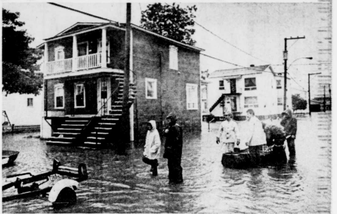
La semaine dernière, la rue principale du quartier sud ressemblait à une "marina". Les citoyens n'avaient pas vu ça l'été, depuis 40 ans.

C'est pour hâter les procédures de dédommagement gouvernemental et soutenir les pressions nécessaires qu'il a jugé bon d'être présent "sans délai" à Québec.