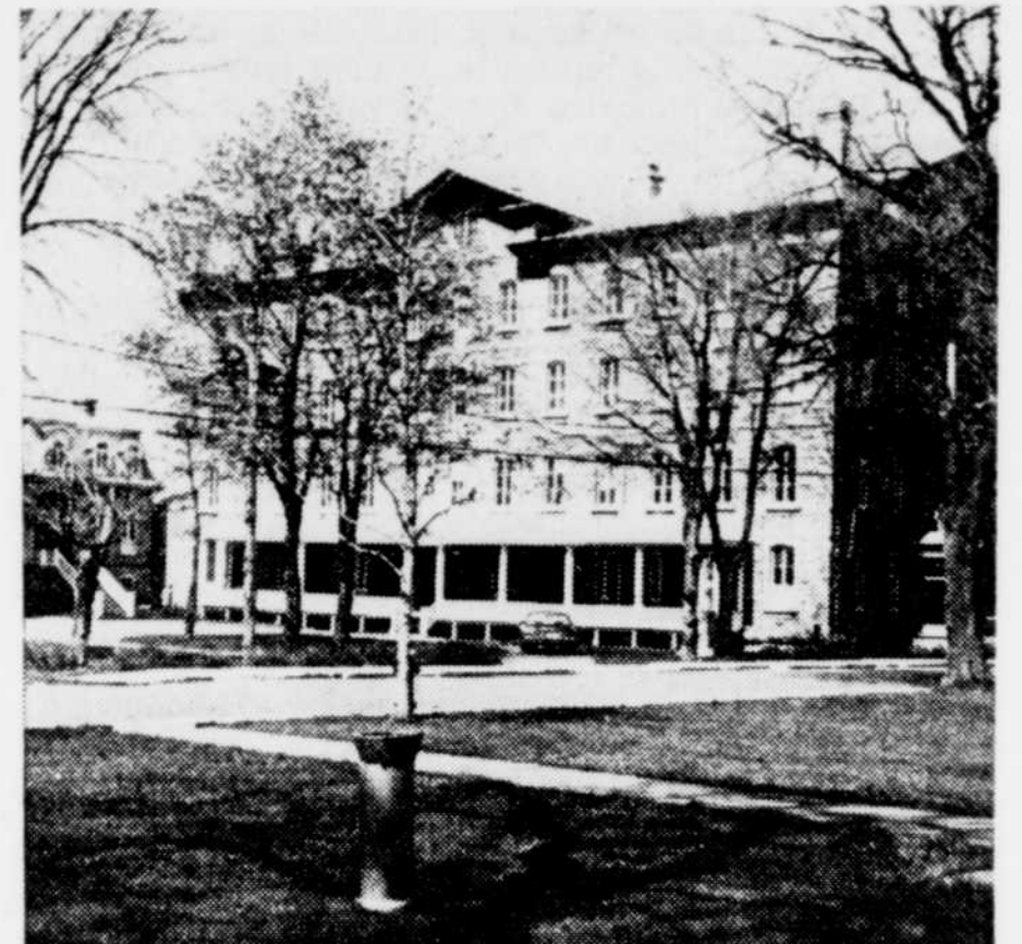
L'ancien édifice de l'école apostolique Notre-Dame, à Lévis, ne restera pas longtemps inoccupé, si le collège de Lévis peut réaliser son projet.