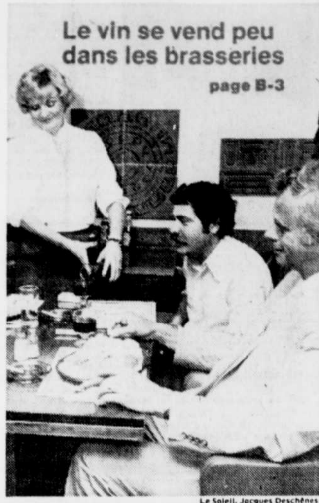
Le vin se vend peu dans les brasseries