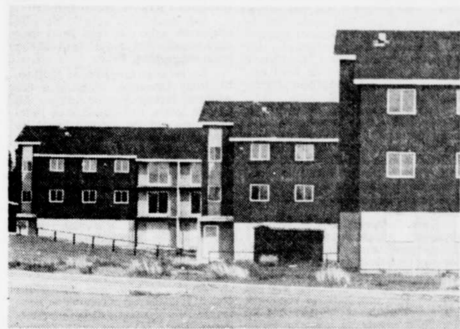
Les maisons à vendre ont perdu le quart de leur valeur marchande.

Et, à l'approche de l'hiver, ce n'est pas fini. Il y a 500 belles maisons à Sept-Iles qui n'ont pas encore trouvé preneur.