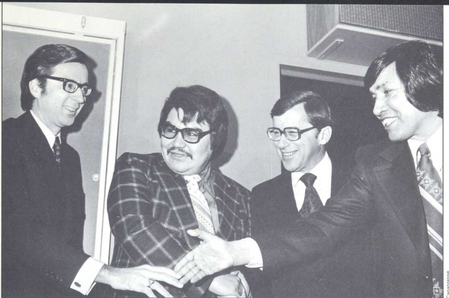
Le Québec se distingue par la signature du premier traité avec les Cris de la Baie James, en 1975.