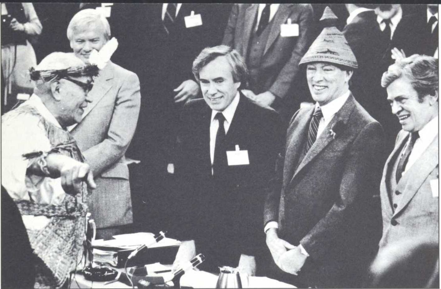
Ottawa 1984. En attendant les véritables négociations constitutionnelles, les premiers ministres se laissent apprivoiser par un chef indien.