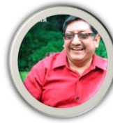
COMITÉ CAMPESINO DEL ALTIPLANO - CCDA - GUATEMALA