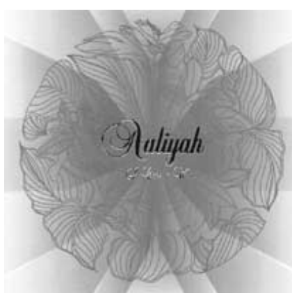
I Care 4 U , paru au milieu du mois de décembre, est le dernier témoignage inédit de cette jeune chanteuse originaire de Brooklyn, disparue à 22 ans.

La seconde partie de l'album est constituée de titres inédits, probablement coupés au montage de l'album Aaliyah (paru quelques mois avant sa mort). Bons pour les fans, quoique inférieurs aux succès précédents. Néanmoins, le premier extrait du disque, l'inédite (et à propos) Miss You , est l'un des succès R&B de l'année aux États-Unis. Cette chanson a valu à Aaliyah d'être en mise en nomination pour la Meilleure performance vocale féminine R&B à la prochaine cérémonie des Grammys.