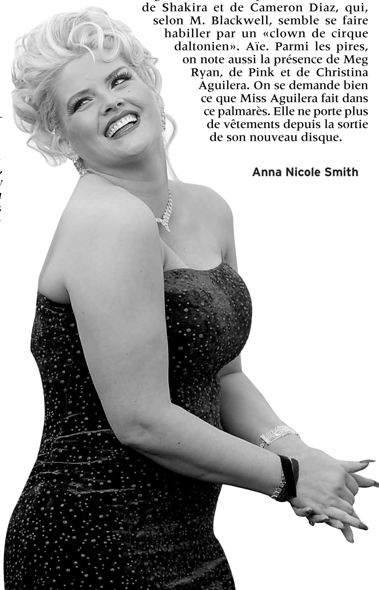
Anna Nicole Smith

POUR NOTRE PLUS GRAND bonheur, lisez ici beaucoup beaucoup d'ironie, un nouveau magazine à vedettes vient d'apparaître dans les kiosques à journaux, dans la section qui contient les Us Weekly et People . Ce petit dernier s'appelle In Touch . Outre les traditionnelles photos de stars au supermarché, In Touch propose toutes les semaines une section «Est-ce vrai?». Non, David Letterman n'est pas secrètement amoureux de J.Lo. Oui, Winona Ryder travaillera pour le designer de vêtements Marc Jacobs, même si elle a volé un de ses chandails l'an dernier. Non, George Clooney ne peut pas se rappeler les noms de toutes les femmes qu'il a fréquentées. Et oui, Leonardo DiCaprio a déjà volé un paquet de gommes quand il était gamin. Vous sentez-vous plus intelligents maintenant?