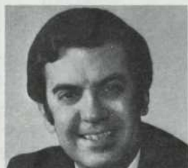
M. Pierre De Bané Député Matapédia- Matane Ministre des Relations extérieures, Canada