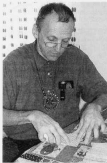
PAPIER- L'artisan montre aux jeunes comment tout fabriquer avec du papier plié.

Cet artiste aime bien prodiguer ses conseils à qui veut en recevoir. «L'origami existe depuis de nombreuses années partout dans le monde et des centaines de millions de personnes pratiquent cet art. Dans la région, même si certaines personnes s'y adonnent, il reste encore beaucoup de chemin à parcourir pour le faire connaître et apprécier», conclut-il.