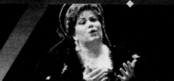
SOPRANO - La chanteuse Manon Feubel se produit sur les plus grandes scènes du monde.

CHICOUTIMI (CL) - «...l'essentiel était bien dans cette voix superbe, généreuse, aussi dans le tempérament dramatique de l'interprète. Ce n'est plus Manon, c'est Marguerite qui chante Schubert et qui nous mène au souvenir délicieux du baiser de Faust... Une parfaite justesse, une totale aisance dans la conduite de la voix, des pianissimos bouleversants et une générosité qui jaillit à chaque phrase.»