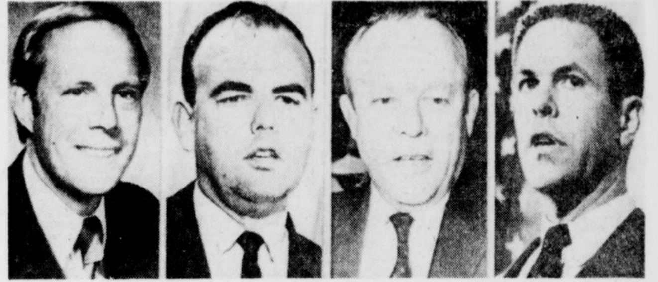
Quatre hautes personnalités qui sont reliées à l'affaire du Watergate ont démissionné au cours de la journée d'hier. Ce sont, de gauche à droite, MM. John W. Dean, conseiller juridique de la Maison blanche, John Ehrlich-

"Le caractère de ma position, parmi votre personnel, a toujours exigé que ma conduite soit à la fois apparemment et réellement au-dessus de tout reproche, poursuivit M. Ehrlichman.