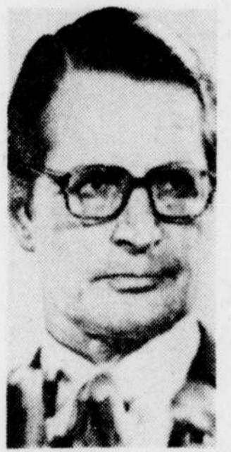
M. Elliot Richardson

WASHINGTON (AFP) — M. Elliot Richardson, nouveau ministre de la Justice, a qui le président Nixon a donné les pleins pouvoirs pour faire toute la lumière sur l'affaire Water-