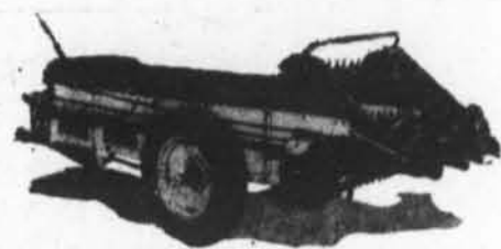
Epandeurs 145 et 125 ml. à p.d.f. Le tablier de l'épandeur opère indépendamment.