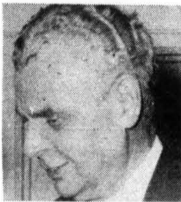
J. DIEFENBAKER (P.C.) 96 sieges