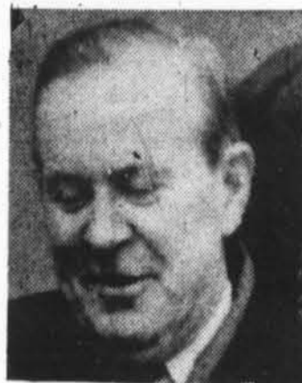
LESTER B. PEARSON (Lib.) 128 sieges