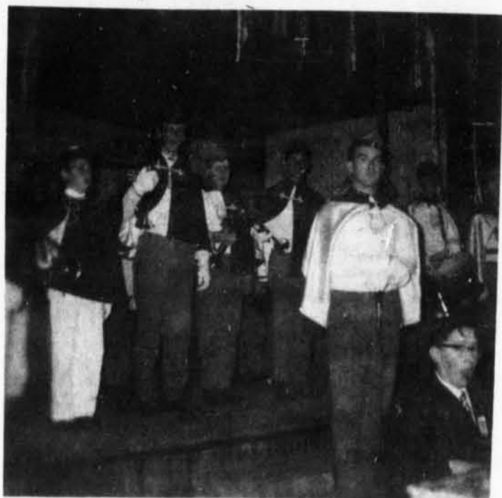
Les élèves de l'école J.M. Robert de St-André-Avellin ont voulu célébrer la semaine étudiante, en organisant un souper-récréatif. La fanfare de Montebello que nous apercevons sur cette photo, s'est joint au groupe, donnant ainsi, plus de vie à la fête.