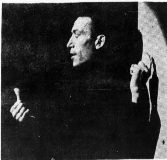
PHILIPPE CLAY, l'un des plus grands fantaisistes du music-hall français, que l'on a surnommé l'acrobate de la chanson, donnera un tour de chant d'une heure à l'émission En habit du dimanche , télévisée au réseau français de Radio-Canada le 14 avril prochain, à 8 heures.