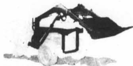
Chargeurs hydrauliques—ultra robustes—fort pratiques—s'adaptent sur la plupart des tracteurs de ferme, modèles "standard" ou "utilité".