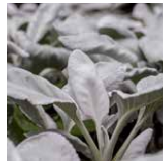
Senecio candicans Angel Wings™ 'Senaw'