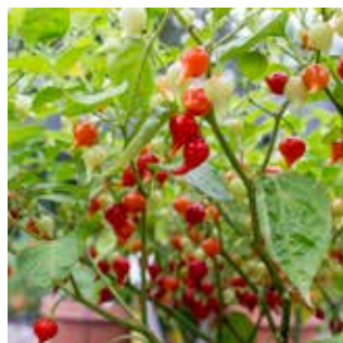
Capsicum chinense 'Biquinho Iracema'