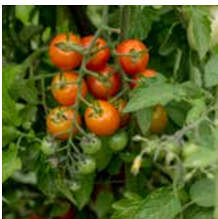
Solanum lycopersicum Profi-Frutti™ Cherry

Pour la première fois en 2018, les semenciers et hybrideurs ont été invités à soumettre des plantes potagères dans le programme. Plusieurs d'entre eux ont répondu à l'appel, dont quelques semenciers québécois. Des 25 variétés soumises, deux se sont distinguées et seront commercialisées au printemps 2019 en tant que plantes potagères Exceptionnelles ® à découvrir.