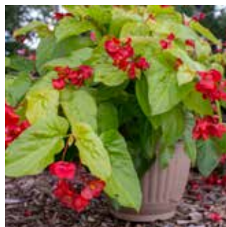
Begonia Canary Wings® PP27149