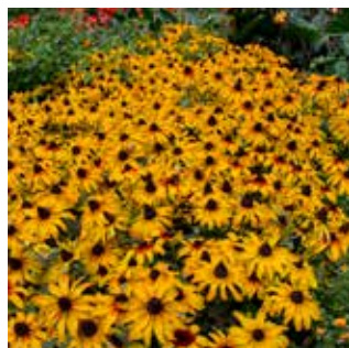
Rudbeckia hirta Rising Sun® Chestnut Gold