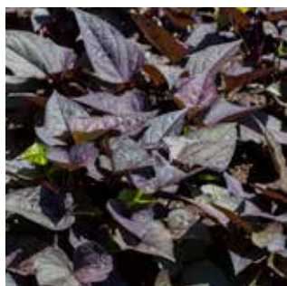
Ipomoea batatas SolarPower™ Black Heart 'Balsolabart'