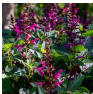
Salvia Rockin® Fuchsia 'BBSAL00301'