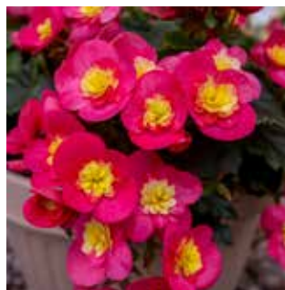
Begonia Valentino Pink® 'KRVALP101'