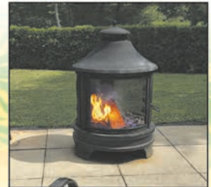
Feu dans un aménagement foyer extérieur, qui est muni d'un pare-étincelle et d'une cheminée