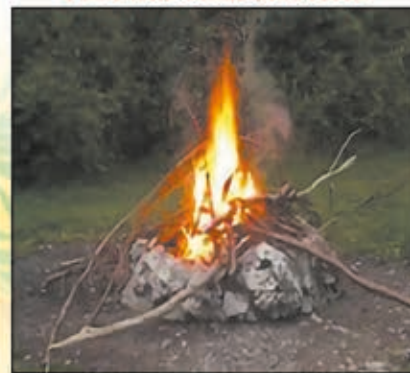
Feu à ciel ouvert