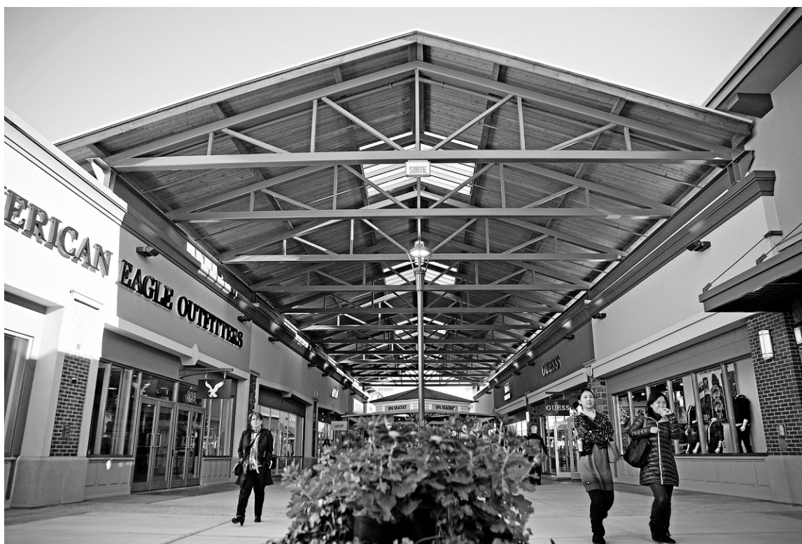
Les Premium Outlets comptent 84 espaces pour accueillir des commerces (boutiques et restaurants). Pour le moment, 64 sont loués à des détaillants. On y retrouve un mélange de marques québécoises et américaines connues.

Quelques magasins ont été pris d'assaut par les clients. C'est le cas de Michael Kors, où 68 personnes (des femmes à 99 %) attendaient en ligne au moment de l'ouverture, à 10h. Tout l'avant-midi, un employé faisait entrer les clients par petits groupes. Au moment de l'ouverture, il y avait aussi une file devant les magasins Coach et Nike. Mais une fois tout le monde entré, ça s'est calmé.