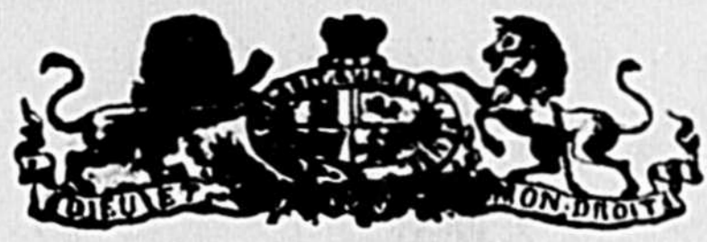
TABLEAU indiquant l'heure de l'arrivée et du départ des malles.