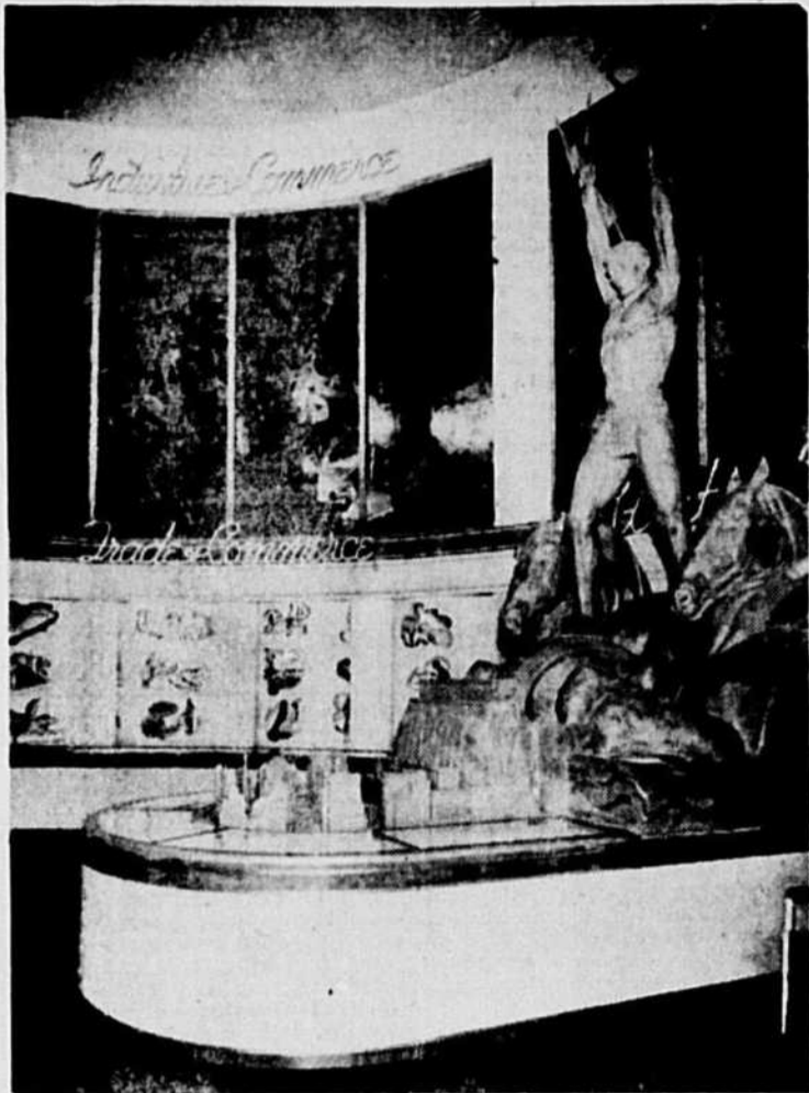
Un des étalages les plus saisissants du pavillon canadien à l'Exposition universelle de New-York, c'est "L'Opulence des ressources hydrauliques du Canada". Ce stand est l'œuvre du ministère des Mines et des Ressources et du ministère du Commerce travaillant de concert.

La devise de l'exhibé est "Le Canada — pays par excellence de l'énergie à prix modique". Il y est illustré que l'expansion des industries canadiennes fondées sur les immenses ressources de notre sol, de nos forêts, de nos mines, etc., est née de la mise en valeur de nos opulentes sources d'électricité peu coûteuse, cause aussi de la vie confortable assurée à la population tant rurale qu'urbaine, d'une extrémité à l'autre du Dominion.