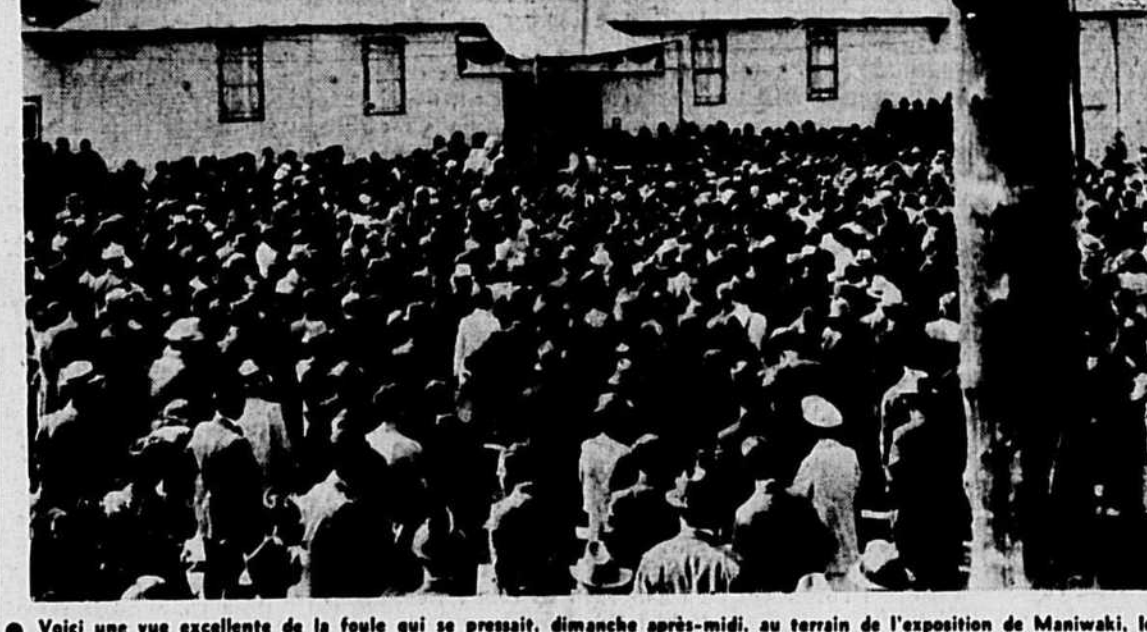
Voici une vue excellente de la foule qui se pressait, dimanche après-midi, au terrain de l'exposition de Maniwaki, lors du grand ralliement libéral organisé à l'occasion du passage de l'hon. Adolphe Godbout, dans le comté de Gatineau.

La Grande-Bretagne et la Hollande se constituent ainsi un pouvoir d'achat dont elles useraient en cas de conflit. — Londres a aussi envoyé pour $300,000,000 d'or au Canada. — Réserve de $1,125,000,000