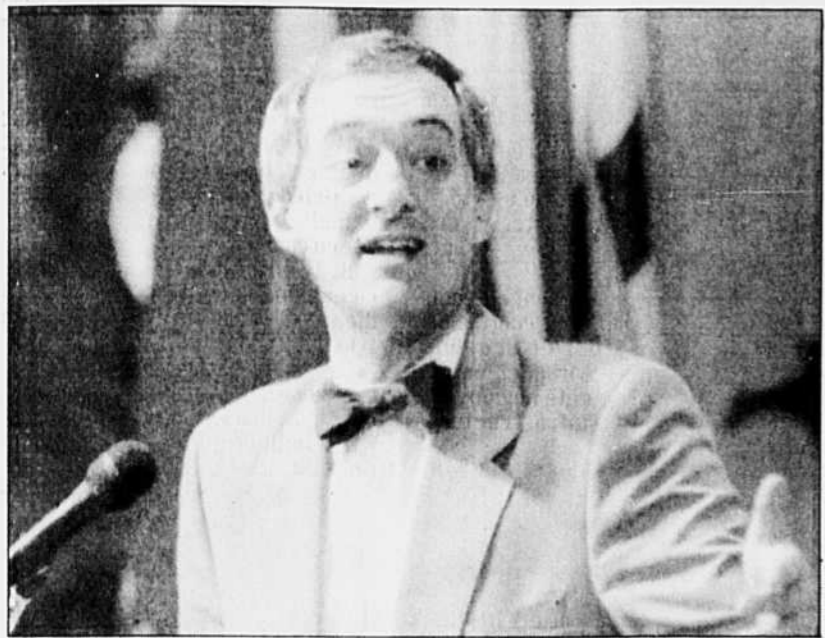
Le gouverneur de la Banque du Canada, John Crow, s'adressait à des courtiers en valeurs mobilières, hier, à Vancouver.

Déjà, Spar a envoyé deux missions de techniciens canadiens en URSS pour évaluer les chances de coopération et des techniciens soviétiques ont visité les installations de Spar à Montréal et à Toronto. Les deux satellites devraient servir aux communications internationales et, selon les dirigeants de Spar, devraient avoir les dimensions d'un satellite ANIK canadien.