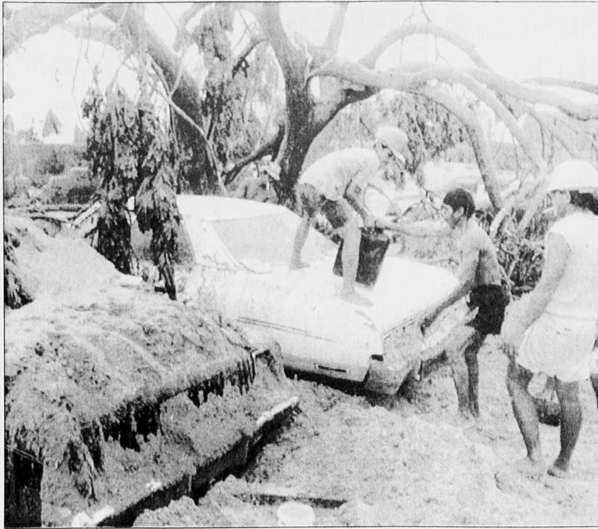
Des tonnes de cendres apportées par la pluie se sont abattues dans la région du volcan.

Cette commission a reçu en un an environ 250 mémoires et entendu maints exposés. Les fonds pour son fonctionnement viennent de l'Association des universités et collèges du Canada (APUC), du Secrétariat d'État et de la Ivey Foundation. Le rapport d'étape de M. Smith s'articule autour de 25 questions qui de-