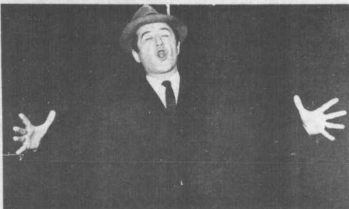
Raymond Lévesque dans un de ses "monologues engagés."