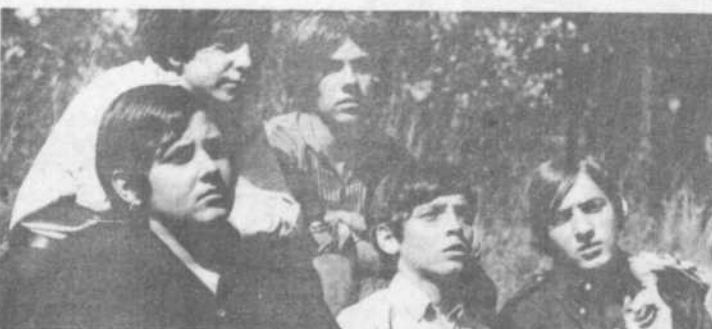
Les Lutins présenteront leur 45 tours très bientôt à Jeunesse d'aujourd'hui.

gravement malade et les médecins considèrent son état comme critique. Au moment d'aller sous presse, la malade reposait toujours dans un état critique.