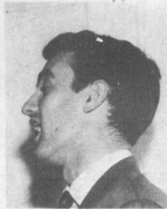
Joel Denis sera remplacé par Michel Louvain.