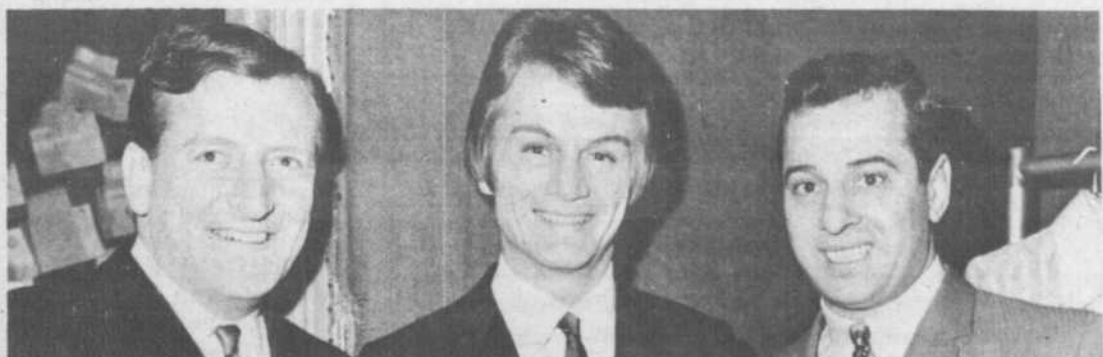
Avec Claude François, Les Jérolas partagent de nombreuses idées sur le sens du spectacle. De cette rencontre à l'Olympia est née une amitié entre ces artistes.

dans la métropole après un triomphe à l'Olympia de Paris, où ils ont passé en américaine du spectacle de Claude François. Ils ont d'ailleurs remporté un succès si grand que Bruno Coquatrix leur a promis un engagement pour 1968. Par ailleurs les Jérolas retourneront en Europe en juillet prochain pour faire une tournée de 5 semaines, pendant lesquelles ils visiteront la Suisse, la Belgique et la France. Ils en profiteront également pour lancer un microsillon à Paris.