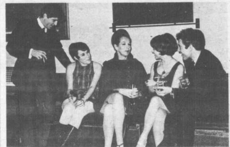
Les comédiens présents à la conférence de presse discutaient de l'accueil que ferait le public.

"Il est une saison" au cours d'une conférence qui s'est tenue dans le hall de la Comédie-Canadienne.