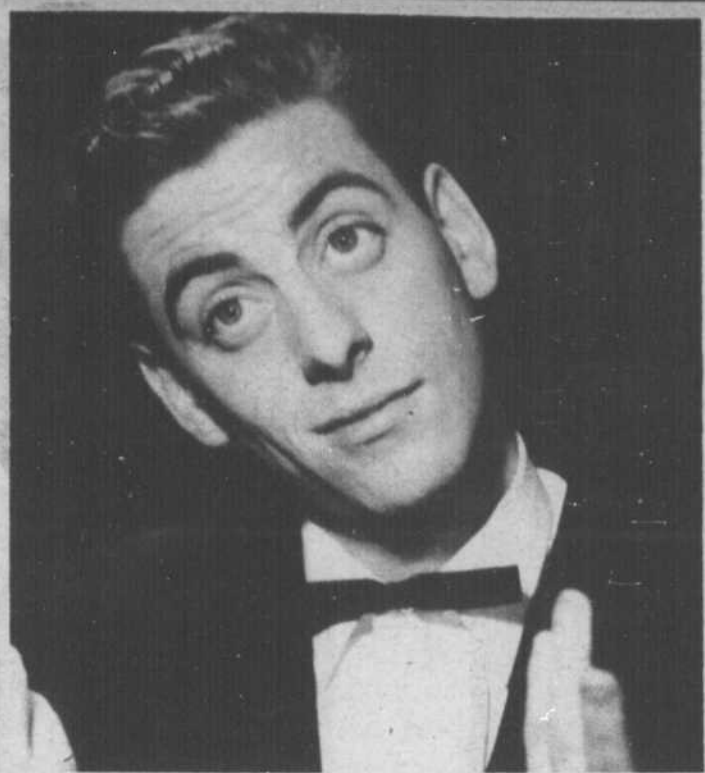
Cachottier, Jacques Desrosiers ne veut rien révéler de ses projets de films.