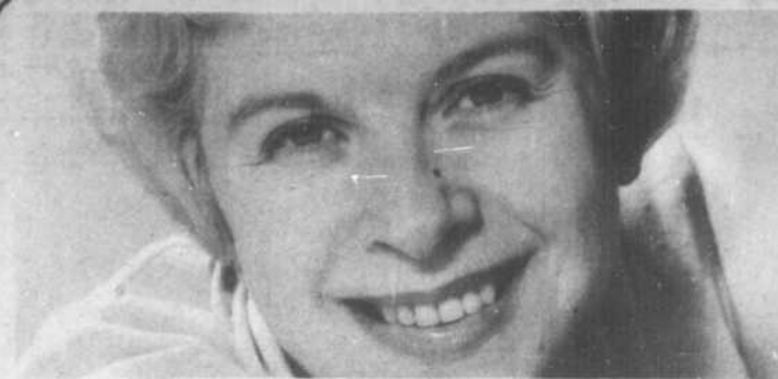
On fétera Clairette pour sa conscience professionnelle et la qualité de son travail.

citoyen canadien, âgé de vingt à trente ans et domicilié au Canada. Deux séries de prix seront décernées, l'une pour les candidats de langue française, l'autre pour ceux de langue anglaise. Les candidats eux-mêmes devront préciser dans quelle catégorie ils se classent. Chaque concurrent devra remplir un bulletin d'inscription où seront donnés tous les règlements de ces concours. Le bulletin et le sujet à traiter seront remis à compter du 12 janvier 1967 sur demande aux Services Culturels de l'Ambassade de France, 42 rue Sussex, Ottawa, où à tout bureau d'Air France ou de la Compagnie Générale Transatlantique. Les résultats du Prix Hachette et Larousse seront proclamés à la fin d'avril 1967.