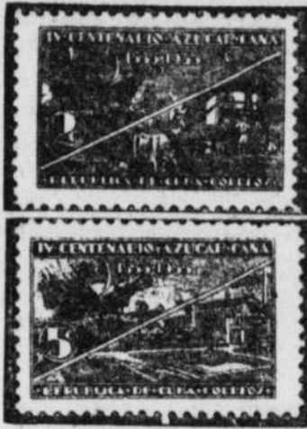
(Vignettes H. E. Harris Co., Boston)

Cuba fête récemment le quatrième centenaire de l'établissement de l'industrie sucrière et, pour en marquer la date, lancait une attrayante série de trois timbres. Ainsi qu'on le peut voir d'après les vignettes ci-contre, le motif principal et constant fait voir la flote de Colomb, tandis qu'un second motif diffère sur chaque timbre montre sur le 1c, vert, une plantation; sur le 2c, rouge, un moulin primitif que font fonctionner des boues et sur le 3c une raffinerie moderne.