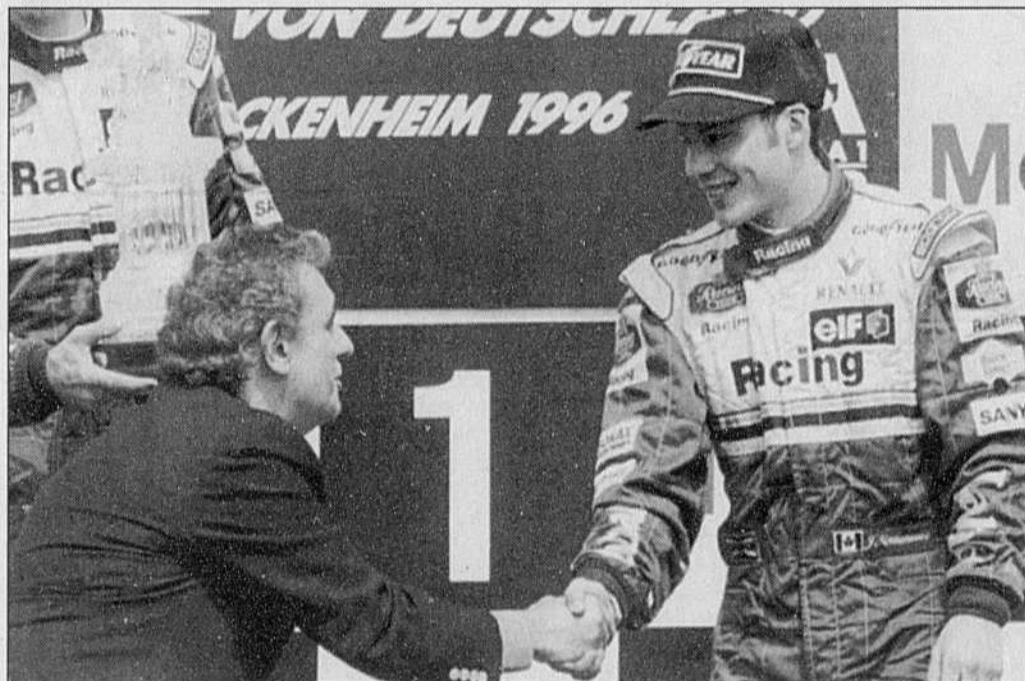
Sur le podium, Jacques Villeneuve a été félicité par le célèbre tenor Plácido Domingo.

La lueur de bagarre restera vraisemblablement vivace jusqu'à la dernière chance.