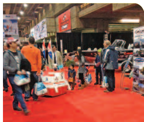
Bobbie attire les petits comme les grands lors d'événements...