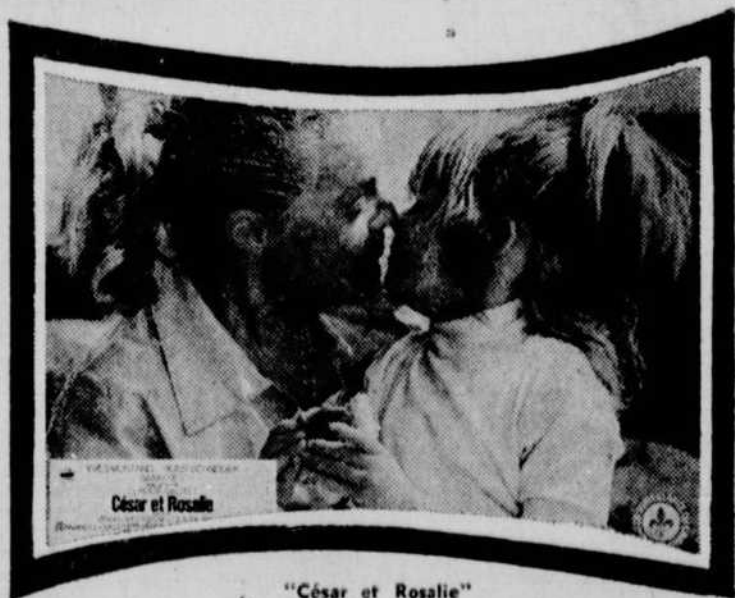
"César et Rosalie"

Un drame psychologique de Claude Sautet avec comme principaux interprètes Yves Montand et Romy Schneider.