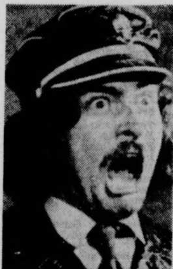
"Après 7h" à la Télévision Communautaire de Québec.