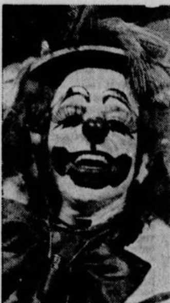
Le clown "Sidner" à Télé-4.