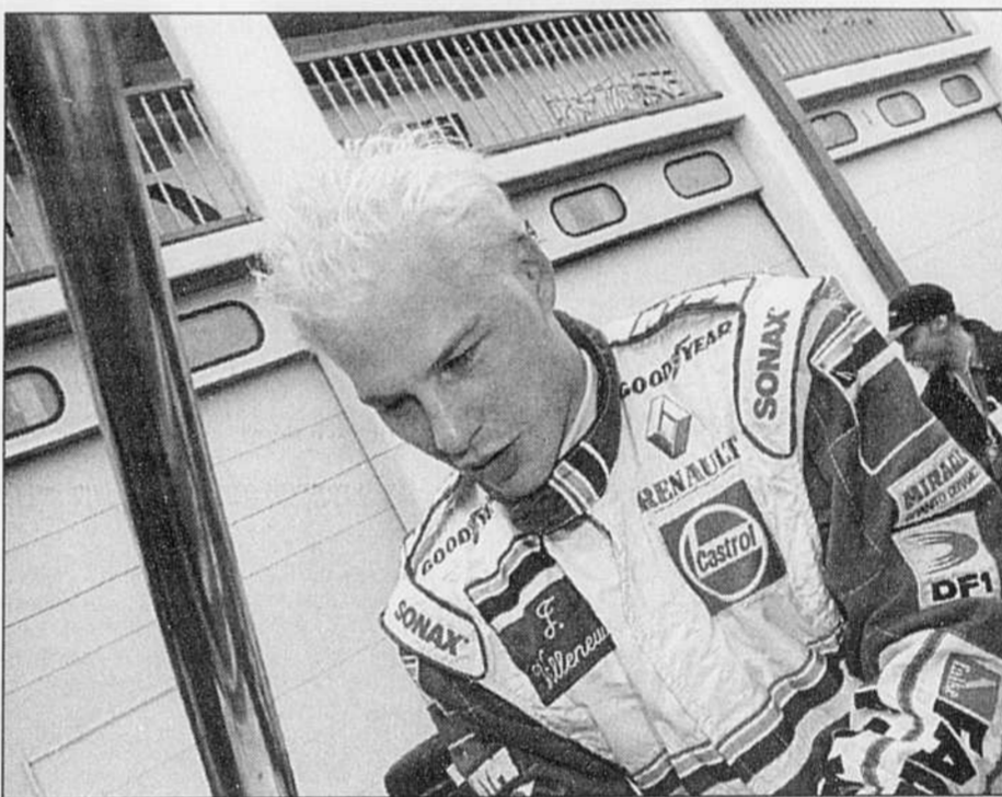
C'est en blond que Jacques Villeneuve s'est présenté au Grand Prix de France: « Si on ne peut plus choisir son look sans engager automatiquement une polémique, ça devient grave. J'avais seulement envie, c'est tout; c'est pour le plaisir de la chose. »

Une inquiétude d'autant plus grande pour lui que ces conditions décuplent le talent de Schumacher et l'efficacité de sa Ferrari. « Ils sont devenus redoutables et, surtout, beaucoup plus fiables que l'an dernier, » a-t-il analysé.