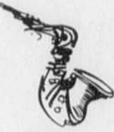
FESTIVAL DE JAZZ DE MONTREAL