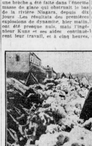
Youngstown, N. Y., 23 — Hier, une brèche a été faite dans l'énorme barrage de glace qui obstruait le bas de la rivière Niagara, depuis dix jours. Les résultats des premières explosions de dynamite, hier matin, ont été presque nuls, mais l'ingénieur Kunz et ses aides ont continué leur travail, et à cinq heures, quantes pieds de bassins

On réussit à faire une brèche dans le solide barrage de la rivière Niagara, et le niveau de l'eau baisse un peu. — Tout danger n'est pas disparu.